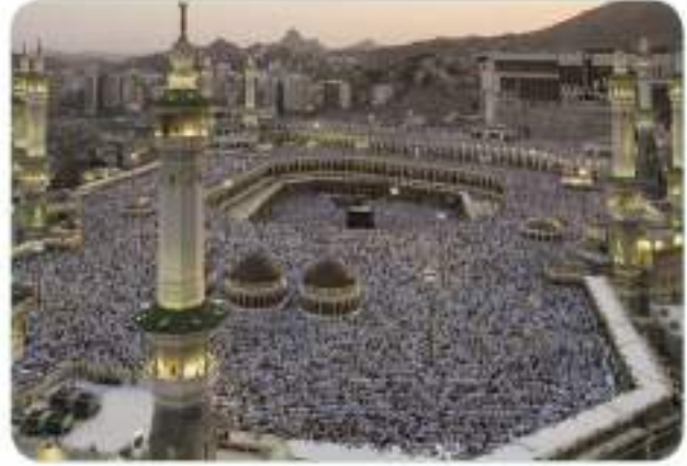
Peygamberimiz (s.a.v.), Arap Yarımadası'nın Mekke şehrinde doğmuştur (Günümüzden bir görünüm).

Âlemlere rahmet olarak gönderilen Hz. Muhammed (s.a.v.), Arap Yarımadası'nın Hicaz Bölgesi'nde yer alan Mekke şehrinde, 571 yılında doğdu. O dönemde Arap Yarımadası'nın en önemli bölgesi Hicaz'dı. Bölgenin tarihi açıdan en eski ve en önemli şehri ise Mekke'ydı. Mekke'de, çok eski dönemlerden beri kutsal olduğu hemen herkes tarafından kabul edilen Kâbe bulunmaktaydı. Yüce kitabımız Kur'an-ı Kerim'de, Kâbe hakkında şöyle buyrulmaktadır: "Şüphesiz, âlemlere bereket ve hidayet kaynağı olarak insanlar için kurulan ilk ev (mabet), Mekke'deki Kâbe'dir." 1