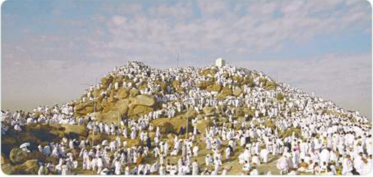
Arafat'ta vakfe yapmak, haccın farzlarından biridir.

inkâr ederse şüphesiz Allah, bütün âlemlerden müstağnidir... " 1 ayetiyle hac farz kılınmıştır. Ancak bu ibadetin nasıl yapılacağını, hadisleri ve uygulamalarıyla Hz. Peygamber (s.a.v.) açıklamıştır. O, bu konuyla ilgili bir hadisinde, " Hac uygulamalarını (yapılışını) benden alın, benden gördüğünüz gibi hac ibadetini yerine getirin. " 2 buyurarak haccın nasıl yapılacağını uygulamalı olarak ortaya koymuştur. Hz. Peygamber (s.a.v.) başka bir hadisinde ise " Hac, Arafat'tır. " 3 buyurmuştur. Böylece o, Arafat'ta vakfe yapmanın hac ibadetinin vazgeçilmez bir şartı olduğunu açıklamıştır.