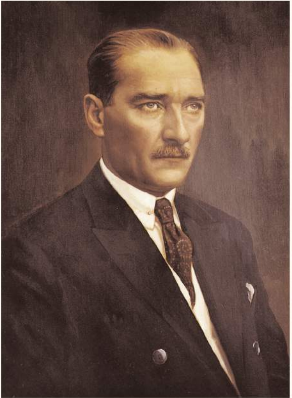
MUSTAFA KEMAL ATATÜRK (1881–1938)