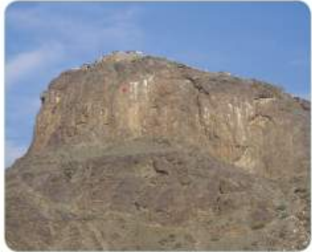
Nur Dağı’ndan bir görünüm

İlk vahiyden sonra aradan haftalar geçmişti. Hız Peygamber (s.a.v.) bu süreçte tekrar vahiy meleği Cebrail (a.s.) ile karşılaşacağını, kendisine Allah’tan (c.c.) vahiy geleceğini umuyordu. Ancak aradan günler, haftalar geçmesine rağmen beklediği şey bir türlü gerçekleşmedi. Rabb’inin (c.c.) kendisini terk ettiğini düşünmeye başlayan Hız Peygamber (s.a.v.), oldukça endişeliydi. Derken bir gün Hız Muhammed (s.a.v.), Hira Mağarası’ndan dönerken vahiy meleği Cebrail (a.s.) tekrar ona göründü. Bunun üzerine Hız Muhammed (s.a.v.) endişe ve heyecan içinde hızla evine gitti. Bu defa vahiy meleği Cebrail (a.s.) ona Müddessir