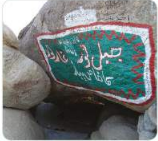
Hz. Peygamber (s.a.v.), hicret sırasında bir süre Sevr Mağarası'nda gizlenmiştir.

Hicret için yola çıkmadan önce emanetleri sahiplerine teslim edip yola çıkan Hz. Ali (r.a.) de Kuba'da onlarla buluştu. Cuma günü olduğunda da tekrar Medine'ye doğru yola çıktılar. Ranuna Vadisi'ne ulaştıklarında cuma namazı farz kılındı.