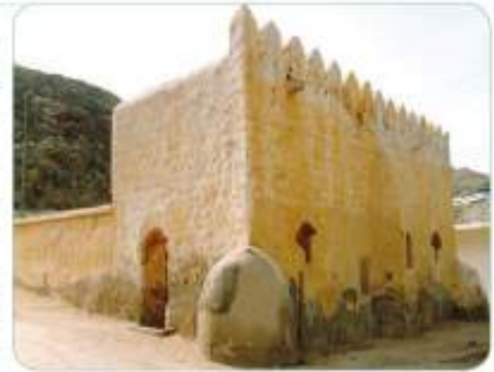
Akabe görüşmelerinin yapıldığı yerden günümüze ait bir görünüm (Akabe Mescid-i Mekke)

Hz. Muhammed (s.a.v.), kendisine yapılan baskılara rağmen İslam'ı anlatmaktan vazgeçmedi. Ancak Mekkeliler, İslam'a karşı neredeyse kendilerini tamamıyla kapatmışlardı. Bu sebeple Allah Resulü (s.a.v.), Mekke dışından hac ibadeti için gelen kişilere İslam'ı anlatmaya daha çok zaman ayırdı. O, 620 yılının hac mevsiminde, Mekke'nin yakınlarında yer alan Akabe'de, Yesrib'li Hazreç kabilesine mensup altı kişi ile bir görüşme yaptı ve onları İslam'a davet etti. Onlar da Müslüman oldular. Bu altı kişi, 621 yılında aynı yerde Peygamberimizle (s.a.v.) buluşma sözü vererek Mekke'den ayrıldı. Onlar, Yesrib'e vardıklarında çevrelerindeki kişilere de Peygamberimizle (s.a.v.) ve İslam'ı anlattılar. Onları dinleyen kişilerden bazıları Müslümanlığı kabul etti. Aradan bir yıl geçmişti. Yesribliler 621 yılında, Peygamberimizle (s.a.v.) sözleştikleri gibi Akabe'ye geldiler. Ancak bu defa on kişi Hazreç, ikisi de Evs kabilesine mensup olmak üzere toplam on iki kişiydiler.