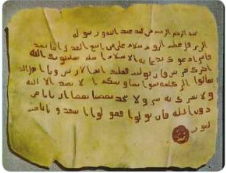
Peygamberimiz (s.a.v.) çeşitli ülkelere İslam'a davet mektupları göndermiştir. (Rum Kayseri Heraklyus'a gönderilen İslam'a davet mektubu)*

Hicret'in sekizinci yılı, İslam davetinin yayılması açısından oldukça önemli bir dönüm noktasıdır. Çünkü Hz. Peygamber (s.a.v.), Hicret'in sekizinci yılına kadar Medine ve çevresinde İslam devletinin temellerini iyice güçlendirmişti. Mekkelilerle saldırı-mazlık anlaşması (Hudeybiye Barış Antlaşması) imzalanmış, insanlara İslam davetini ulaştırmak için oldukça uygun bir ortam oluşmuştu. İşte böylece Hz. Peygamber (s.a.v.), çevre ülke hükümdarlarına elçiler gönderip onları İslam'a davet etti. Seçkin sahabelerden oluşan bu elçiler, yanlarında Hz. Peygamber (s.a.v.) tarafından yazılmış İslam'a davet mektupları taşıyordu.