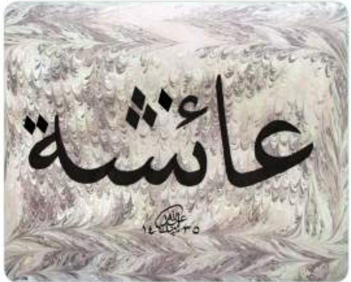
Hız. Âişe - yazıtlı bir hat örneđi

Hız. Âişe (r.a.), Hız. Peygamber'e (s.a.v.) vahyin doğrudan geliđine şahit olmuştur. Bu konudaki bilgi birikimiyle ve ilmi kişiliđiyle de çevresindeki Müslümanlara yol göstermiştir.