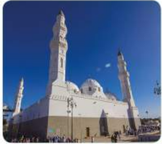
Kuba Mescidi: (Günümüzden bir görünüm.)