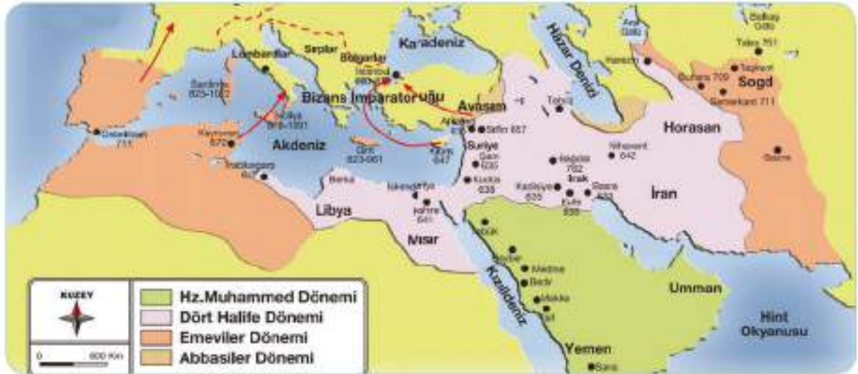
İslam'ın yayılışını gösteren bir harita

634 yılında Hz. Ebû Bekir'in (r.a.) vefatından sonra Hz. Ömer (r.a.) halife olmuştur. Hz. Ömer (r.a.) Dönemi İslam davetinin geniş coğrafyalara yayıldığı bir dönem olmuştur. Bu dönemde, Müslüman Arapları kendileri için tehlike olarak gören, İslam'ın yayılmasına engel olmak isteyen Sasaniler ve Bizanslılarla birçok savaş yaşanmıştır. Mesela 636 yılında Sasanilerle yapılan Kadisiye Savaşı'nda iki taraf arasında büyük çatışmalar yaşanmış, savaş Müslüman Arapların galibiyetiyle sonuçlanmıştır. Kadisiye Savaşı sonunda, Müslümanlar İran'ın iç bölgelerine kadar ilerlemişlerdir. Irak ve İran'ın batı bölgeleri de bütünüyle Müslüman Arapların hâkimiyetine girmiştir. Yine Hz. Ömer (r.a.) zamanında, 642 yılında yaşanan Nihavend Savaşı'ndan sonra da Müslümanlar bütün İran'ı fethetmişlerdir.