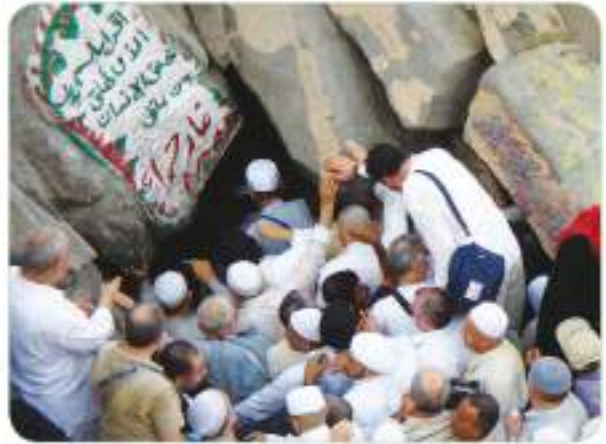
Peygamberimize (s.a.v.) ilk vahyin geldiği Hira Mağarası

Aradan yıllar geçmiş, Allah'ın elçisi Hz. Muhammed (s.a.v.) kırk yaşına gelmişti. 610 yılının Ramazan ayında, her yıl olduğu gibi yine Nur Dağı'ndaki Hira Mağarası'na gidip inzivaya çekilmişti. Hz. Muhammed (s.a.v.), Ramazan ayının 27. gecesinde hiç beklemediği bir durumla karşılaştı. Vahiy meleği Cebrail (a.s.) ona göründü. Hz. Muhammed (s.a.v.) endişe ve şaşkınlık içerisindeydi. Cebrail (a.s.) ona, "Okul" dedi. Hz. Muhammed (s.a.v.) ise ona, "Ben okuma bilmem." diyerek karşılık verdi. Cebrail (a.s.), ona üçüncü kez "Okul" dedi. Hz. Muhammed (s.a.v.) yine "Ben okuma bilmem."