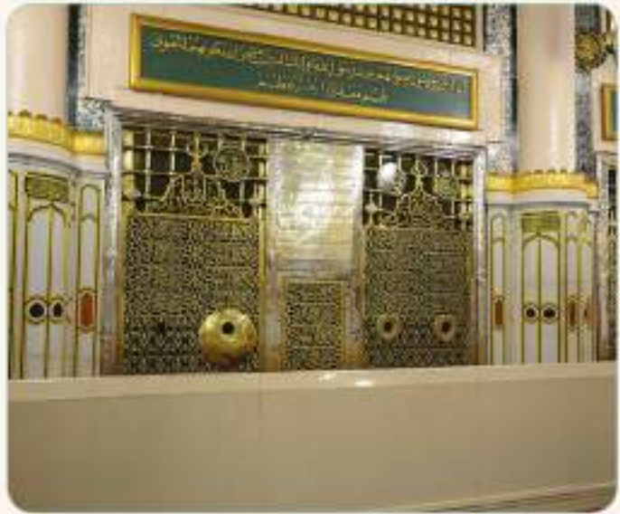
Peygamberimizin (s.a.v.) kabri (Mescid-i Nebi'nin içindedir.)

Hz. Muhammed (s.a.v.) de hepimiz gibi bir anne-babanın çocuğu olarak dünyaya gelmiş bir insandı. O da her insan gibi zaman zaman sevinir, kızar, acıkınca yemek yer, yorulunca dinlenir, bazen de hastalanırdı. İşte bu mübarek insan, 632 yılında Veda Haccı'nı yapıp Medine'ye döndükten bir süre sonra hastalandı. Hastalığı gün geçtikçe artan Allah Resûlü (s.a.v.) mescide bile çıkamaz oldu. Namazları kıldırması için yerine Hz. Ebû Bekir'i (r.a.) görevlendirdi. Yaklaşık iki hafta kadar hasta yatan Hz. Peygamber (s.a.v.), 8 Haziran 632'de vefat edip Allah'ın (c.c.) rahmetine kavuştu.