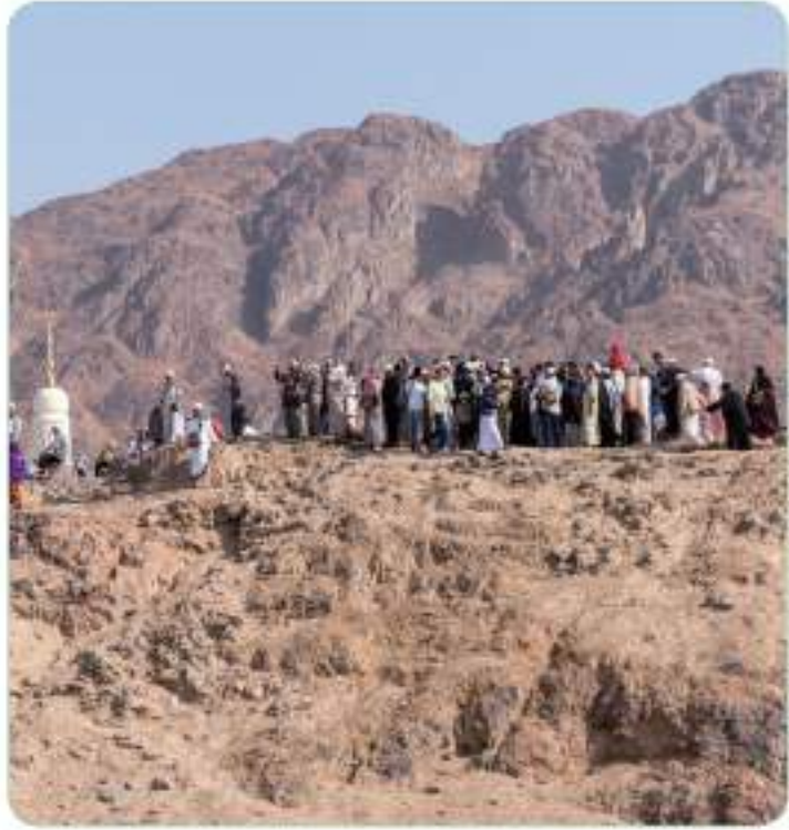
Uhud Savaşı'nın yapıldığı Uhud Dağı'nı ziyaret eden Müslümanlar

Ayneyn Tepesi'ni gören bir yerde, Halid bin Velid komutasında atlı bir birlik bulunuyordu. Savaşın başından beri okçuları gözetleyen Halid bin Velid komutasındaki atlı birlik hemen harekete geçti. Bu birlikteki müşrik askerler, tepede kalan okçuları şehit ettiler. Daha sonra da nasıl olsa savaşı kazandık düşüncesiyle ganimet toplayan Müslümanlara arkadan saldırdılar. Bu olayı görünce savaş alanından kaçmakta olan müşrikler de geri döndüler. Böylece Müslümanlar iki ateş arasında kaldı. Müşriklere ait iki güç arasında kıskaç altında kalan Müslümanlar paniğe kapılıp Peygamberimizin (s.a.v.) belirlediği savaş düzenini de bozdular. Bitti zannedilen savaş yeniden şiddetlendi. Bu kargaşada birçok Müslüman şehit oldu. Sevgili Peygamberimiz (s.a.v.) de yaralandı. Kendisine isabet eden bir taşla Hz. Peygamber'in (s.a.v.) dudağı yarıldı, dişi kırıldı. Bazı Müslümanlar, Hz. Peygamber'in (s.a.v.) şehit olduğunu zannedip iyice paniklediler. Allah'ın Resûlü (s.a.v.) yaşıyordu. Sevgili Peygamberimiz (s.a.v.), çevresindeki Müslümanlarla beraber Uhud Dağı'na çekildi.