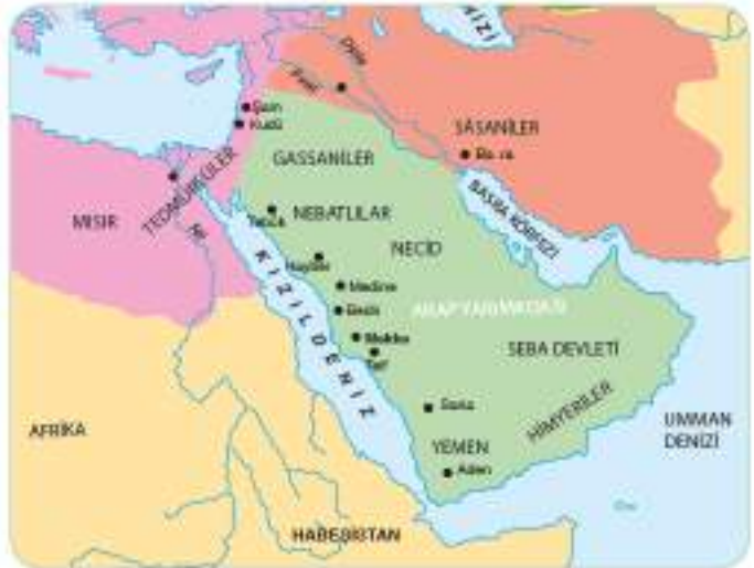
Bir grup Müslüman, 615 yılında Mekke'den Habeşistan'a hicret etmiştir.

Habeşistan'a yerleşenlerin güven içinde yaşamaları ve Müslümanların sayısının günden güne artması Mekkeli müşrikleri daha da öfkeliyordu. İslam'ın yayılmasını bütünüyle engellemek isteyen müşrikler, Müslümanlara ve onlara sahip çıkan putperest akrabalarına boykot uygulama kararı aldılar. Müşrikler, 616 yılında kendi aralarında yaptıkları anlaşma gereğince Müslümanlarla ekonomik ve sosyal bütün ilişkilerini kestiler. Onlarla kız alıp vermediler, alışveriş yapmadılar ve hiçbir ilişki kurmadılar. Uygulanacak boykotla ilgili kararları da yazıya geçirip Kâbe'nin duvarına astılar.