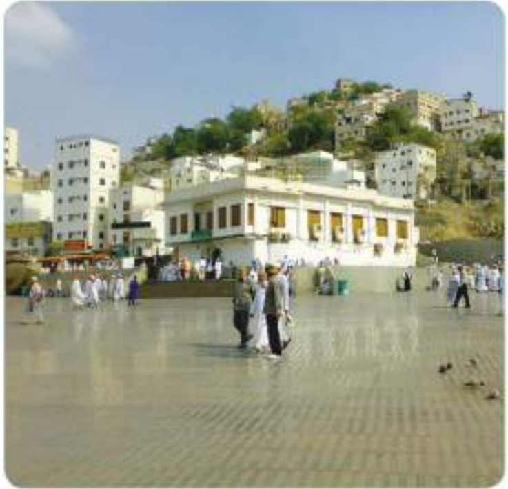
Peygamberimizin (s.a.v.) doğduğu evin yerinde günümüzde küçük bir kütüphane bulunur (Mekke).

Mekke'nin havası ve iklim şartları, bebeklerin sağlıklı gelişmesi için uygun değildi. Bu sebeple maddi durumu uygun olan aileler, yeni doğan bebeklerini genellikle iki yıllığına göçebe kabilelere mensup sütannelere verirlerdi. Böylece çocuklar, çölün temiz havasında, sağlıklı bir şekilde büyüdüler. Ayrıca sütanneye verilen çocuklar, ana dilleri olan Arapçayı duru bir şekilde öğrenme imkânı bulurdu. Hız. Muhammed (s.a.v.) de bu geleneğe uyularak çölde göçebe hayatı yaşayan, Sa'doğulları kabilesinden Halime adında bir sütanneye verildi.