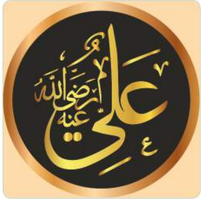
Arapça Hz. Ali (r.a.) yazılı bir hat örneği

Hz. Ali (r.a.), Hz. Peygamber'in (s.a.v.) en çok güvendiği, sevdiği ve değer verdiği âlim sahabilerden biridir. O, Hicret'ten önce, Hz. Muhammed'in (s.a.v.), kendisinde bulunan emanetleri teslim ettiği, hatta büyük bir tehlike altında sabaha kadar evinde kalmasını istediği kişidir. Hz. Ali (r.a.) de gözünü kırpmadan ve hiçbir şeyden korkmadan Mekkeli müşrik sul-kastçıların kuşattığı, Hz. Peygamber'in (s.a.v.) evinde kalmış ve sabaha kadar da orada beklemiştir. Böylece Hz. Peygamber (s.a.v.) de gözü arkada kalmadan hicret yolculuğuna çıkmıştır. 4