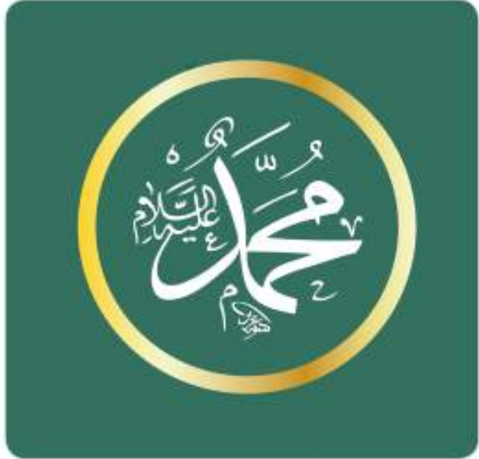
Hz. Muhammed (a.s.), Allah (c.c.) tarafından gönderilmiş son peygamberdir.

Bahira, kervanda bulunan kişileri yemeğe davet etti. Ancak o, gelenler arasında son peygamberin vasıflarına sahip biri olmadığını hemen fark etti. Çünkü kervandakiler Hz. Muhammed'i (s.a.v.) eşyaların ve hayvanların başında bekçi bırakmışlardı. Konuşmalar sürerken geride bırakılan bir çocuk olduğunu duyan Bahira, onun da yemeğe katılmasında ısrar etti. Böylece Hz. Muhammed (s.a.v.) de yemeğe katıldı. Bahira, yemek boyunca hayretle bu çocuğu gözlemledi. Çünkü bu çocuk, tavır ve hareketleriyle diğerlerinden oldukça farklıydı. Bahira, yemekten sonra Hz. Muhammed'i (s.a.v.) ve amcasını ayrı bir odaya çağırdı. Bir süre onlarla konuştu. Hz. Muhammed'in (s.a.v.) soyu, ailesi ve özellikleri hakkında bilgi aldı. Onlardan duyduğu şeylerin, kendi öğrendiği bilgilerle uyumlu olduğunu gördü. Bahira, Ebû Talip'e, çocuk hakkındaki fikirlerini anlattı. Bu çocuğu Şam'a götürmemesi gerektiği konusunda onu uyardı. Çocuğu Şam'a götürdüğü takdirde Yahudilerin bu çocuğa zarar verebileceklerinden korktuğunu Ebû Talip'e ifade etti. Bahira'yı dikkate alan Ebû Talip, getirdiği malları satıp Mekke'ye geri döndü. 1 Hz. Muhammed (s.a.v.) Mekke'ye döndükten sonra da amcalarıyla ticaret yapmaya devam etti. Mesela o, on yedi yaşındayken amcası Zübeyr ile Yemen'e giden bir ticaret kervanına katıldı.