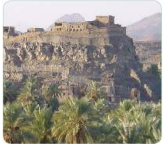
Müslümanlar 628'de Hayber'i fethetmişler. (Hayber Kalesi)

Medine'nin kuzeydoğusunda, Suriye yolu yakınında, Hayber adında bir Yahudi yerleşim yeri vardı. Antlaşmalara uymamaları sebebiyle Medine'den çıkarılan Yahudilerin çoğu buraya gelip yerleşmişlerdi. Hayber Yahudileri sürekli Müslümanların aleyhine çalışmalar yapıyor ve müşrik Arapları Müslümanlara karşı kışkırtıyorlardı. Zaten Peygamberimizin (s.a.v.) canına kast