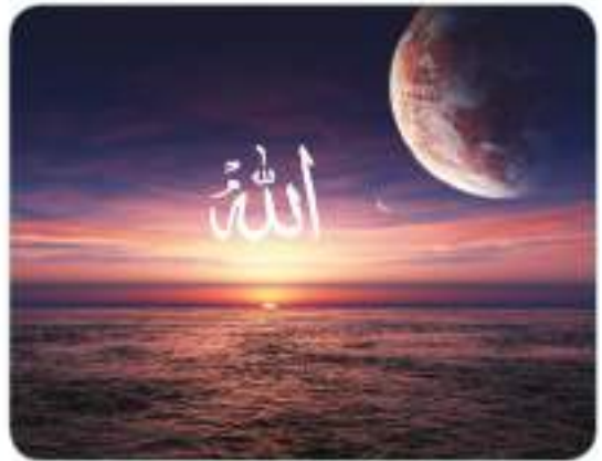
Hz. Muhammed (s.a.v.) müşrikleri, yerleri ve gökleri yaratan Yüce Allah’a iman etmeye çağırmıştır.

Sevgili Peygamberimiz (s.a.v.), kendisine verilen görevi layıkıyla yapmak için canla başla çalışıyordu. O, bir gün Safâ Tepesi’ne çıkarak Kureyşlilere şöyle seslendi: “ Ey Kureyş topluluğu! Size, şu dağın eteğinde bir süvari birliği var, desem bana inanır mısınız? ” Kureyşliler de ona, “Evet, inanırız. Çünkü şimdiye kadar senden hiç yalan duymadık.” dediler. Bunun üzerine Peygamberimiz (s.a.v.), “ O hâlde ben size, önümüzde şiddetli bir azap günü bulunduğunu haber veriyorum... Siz, 'Allah'tan başka ilah yoktur.' demedikçe