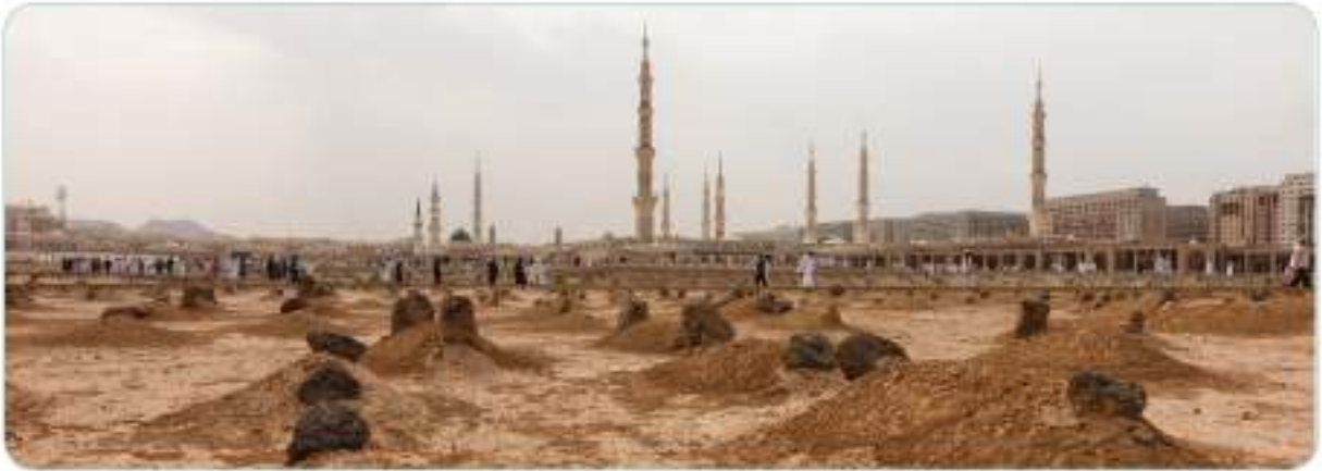
Cennetü'l Bâki Mezarlığı/Medine

Medine'ye ilk hicret edenler arasında olan Abdullah bin Mesud (r.a.), İslam'ın başlangıç zamanından beri Hz. Peygamber'e (s.a.v.) hep yakın olmuş ve onun katıldığı bütün savaşlara katılmıştır. Hz. Peygamber'in (s.a.v.) evine rahatça girip çıkabilen bir kişi olduğu için yabancılar onu, Resûlullah'ın (s.a.v.) ailesinden sanırdı. Ahlaki yönden de Allah Resûlü'ne en fazla benzeyen sahabe olarak kabul edilirdi. Resûlullah (s.a.v.) onu çok sever ve kendisine güvenir, zaman zaman iltifatta bulunurdu. 2 Bir keresinde bazı sahabiler, zayıf ve çelimsiz bir vücuda sahip olan Abdullah bin Mesud'un (r.a.) zayıf bacağına bakıp gülmüşlerdi. Bunu gören Hz. Peygamber (s.a.v.), "Ne gülüyorsunuz? Abdullah'ın bir tek ayağı, kıyamet günü mizanda Uhud Dağı'ndan daha ağırdır." 3 buyurmuştur.