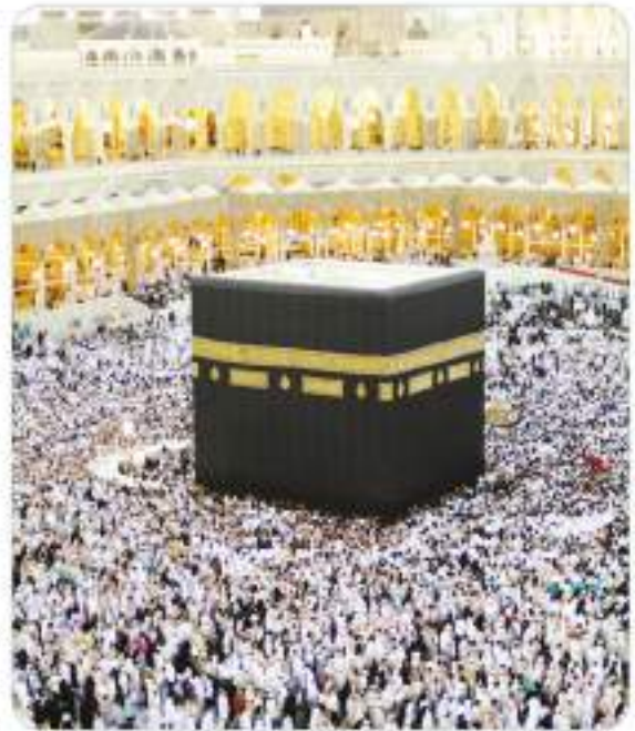
Kâbe'nin günümüzden bir görünümü

Müslümanlara yönelik baskı ve işkenceler gün geçtikçe artıyordu. Bazı Müslümanlar, işkencelere dayanamaz hâle geldi. Öyle ki sonunda korkulan şey gerçekleşti. Genç sahabilerden biri olan Ammâr'ın annesi Sümeyye ve babası Yâsir, işkencelere dayanamayarak şehit oldu. Bunlar, putlara tapmayı reddedip Müslümanlığı kabul eden ilk şehitlerdi. Onların oğulları Ammâr (r.a.) da ağır işkencelere maruz kaldı.