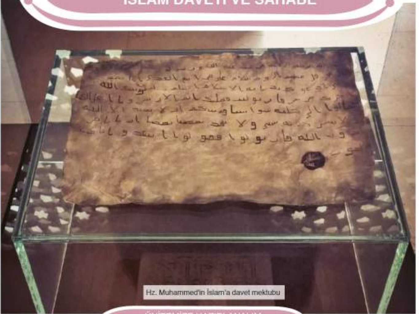
Hız. Muhammed'in İslam'a davet mektubu