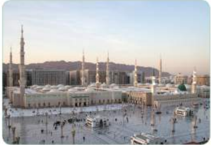
Mescid-i Nebî ve Medine'den bir görünüm

Hicret'ten sonra Medine'de İslam toplumunun oluşmasına katkı sağlayan birçok uygulama yapılmıştır. Müslümanların; cuma, bayram ve vakit namazlarında düzenli olarak Hz. Peygamber'le (s.a.v.) bir araya gelmeleri, ibadet etmeleri ve onunla konuşup görüşmeleri bu uygulamalardan bazılarıdır. Ayrıca Müslümanlardan birçoğunun, kadın-erkek ayırt etmeksizin Mescid-i Nebî'de düzenlenen eğitim faaliyetlerine katılması, bir araya gelip konuşması, Hz. Peygamber'le (s.a.v.) görüşmesi ve sohbet etmesi de bu çerçevede sayılabilecek örneklerdendir.