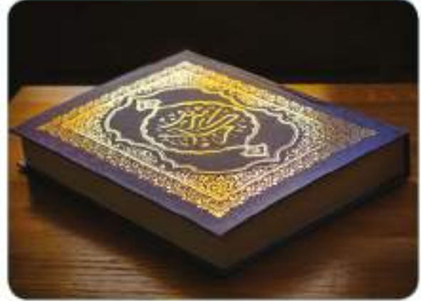
Hız. Peygamber (s.a.v.) zaman zaman Kur'an ayetlerini sahabilere açıklamıştır.

Kur'an-ı Kerim'de yer alan birçok ayette, Hız. Peygamber'in (s.a.v.) dindeki konumunu ve önemini ifade eden bilgiler yer alır. Mesela Nûr suresinde yer alan bir ayette şöyle buyrulur: "Allah'a itaat edin, Peygamber'e itaat edin." de. Eğer yüz çevirirseniz bilin ki ona yüklenen sorumluluğu ancak ona ait; size yüklenen görevin sorumluluğu da yalnızca size aittir. Eğer ona itaat ederseniz doğru yola erersiniz. Peygamber'e düşen ancak apaçık tebliğdir." 4 Aynı konuyu dile getiren başka bir ayette ise yine "Allah'a itaat edin, Peygamber'e de itaat edin..." 5 buyrulur Hız. Peygamber'e (s.a.v.) itaat etmenin dinî açıdan önemi vurgulanır. Bu ayetlere göre Allah'a (c.c.) itaat ile Peygamber'e (s.a.v.) itaat aynı anlama gelmektedir. Hız. Muhammed (s.a.v.), Allah'ın (c.c.) insanları karanlıklardan aydınlığa kavuşturmak amacıyla gönderdiği son peygamberdir. Dolayısıyla onun getirdiği ilkeleri benimsemek ve Hız. Peygamber'in (s.a.v.) uygulamalarını (sünneti) dikkate alıp yaşatmak, doğrudan Allah'ın (c.c.) dinine uymak demektir. Çünkü Hız. Muhammed (s.a.v.), Allah'ın (c.c.) dininin ve Kur'an'ın hem tebliğcisi, açıklayıcısı hem de uygulayıcısıdır. Onun uygulamaları, açıklamaları ve örnekliği olmadan dinî doğru anlamak mümkün olmaz.