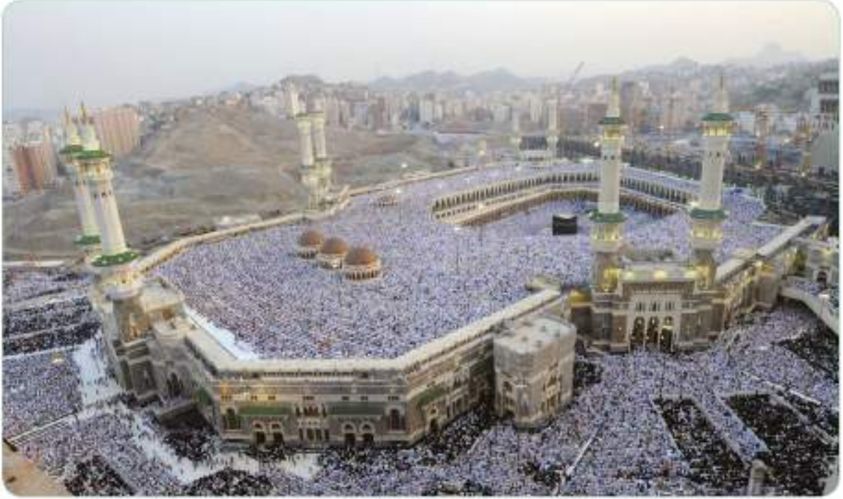
Hac ibadetinin yapıldığı Mekke ve Kabe'den bir görünüm

Fetihten bir süre sonra Hicret'in 9. yılında ( Miladi 631) hac ibadeti farz kılınmıştı. Allah Resûlü (s.a.v.) o sene hacca gitmemiş, yerine Hz. Ebû Bekir'i (r.a.) hac emiri olarak görevlendirmişti. Ancak bir yıl sonra Hz. Peygamber (s.a.v.), hac ibadetini yerine getirmek için beraberindeki Müslümanlarla Mekke'ye doğru yola çıktı. Hz. Muhammed'in (s.a.v.) hac için Mekke'ye gittiğini duyan pek çok Müslüman da ona katıldı. Yolda kendisine katılanlarla birlikte on binlerce Müslüman, günler sonra Mekke'ye ulaştı. Bu hac, Hz. Peygamber'in (s.a.v.) ilk ve son hacıydı. Zaten Peygamberimiz (s.a.v.), hac ibadeti sırasında Müslümanlarla vedalaştığı ve bir daha Kâbe'yi göremediği için bu hacca "Veda Haccı" adı verilmiştir.