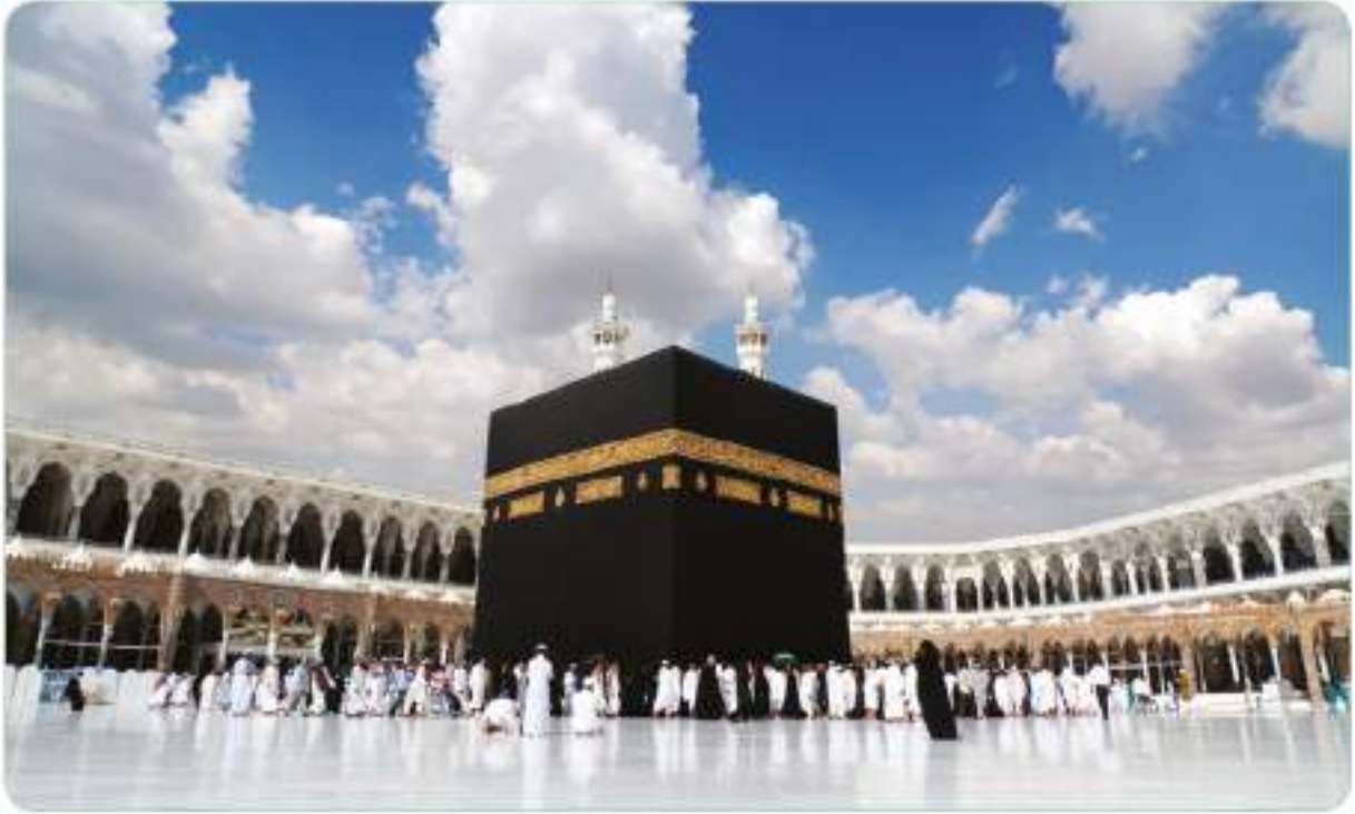
Hz. Peygamber (s.a.v.) Mekke'nin fethinden sonra Kâbe'yi putlardan temizlemiştir. (Günümüzden bir görünüm)

Mekkeli müşrikler yıllarca Müslümanlara baskı uygulamış, İslam'ın yayılmasını engellemiştir. Onların baskıları sonucunda Müslümanlar Medine'ye hicret etmek zorunda kalmıştır. Son olarak Mekkeli müşrikler Müslümanlarla yaptığı Hudeybiye Antlaşması'nı da bozdular. Bütün bunlardan dolayı Hz. Muhammed (s.a.v.), 630 yılının Ramazan ayının 10. gününde, on bin kişilik bir orduyla Medine'den yola çıktı. O, az sayıda sahabi hariç hiç kimseye, nereye gidildiğini ve düşmanın kim olduğunu söylemedi. Sefere çıkanlardan kimi Suriye'ye, kimi Taif'e, kimi de Hevâzin'e gidildiğini sanıyordu. Nihayet İslam ordusu bazı yerlerde konaklayıp dinlenerek Mekke'ye, Taif'e ve Hevâzin'e oldukça yakın bir yer olan Merruzzeheran bölgesine kadar geldi. Peygamber Efendimiz (s.a.v.) yatsı namazı vaktinde herkesin dağılarak birer ateş yakmasını emretti. Herkes hızlı bir şekilde odun, çalı çırpı toplayarak emri yerine getirdi. Aniden yakılan binlerce ateş, etrafı ışıl ışıl aydınlattı. Yakılan ateşler hedefin Mekke olduğunu gösteren bir işaretti. Çünkü oraya en yakın şehir Mekke'ydі. Yapılan hazırlıklardan ve burunlarının dibine kadar gelen İslam ordusundan habersiz olan Mekkeli müşrikler, geceyi aydınlatan ateşleri görünce neye uğradıklarını şaşırıldılar. Hemen liderleri Ebû Süfyan'ı göndererek ondan, gelenlerin kim olduğunu ve amaçlarının ne olduğunu öğrenmesini istediler.