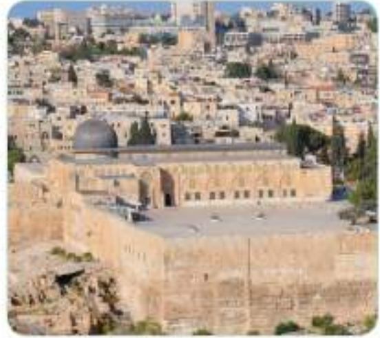
Peygamberimiz (s.a.v.), Miraç Gecesi Mekke'den Mescid-i Aksa'ya götürülmüştür. (Mescid-i Aksa/Kudüs)

Üst üste gelen acılar ve yaşadığı olumsuzluklar Hz. Muhammed'i (s.a.v.) çok üzmüştü. Rabb'imiz (c.c.), üzüntüsünü hafifletmek amacıyla ona İsrâ ve Miraç mucizelerini yaşattı. Buna göre Peygamber Efendimiz (s.a.v.), bir gece Mekke'deyken yatağından alınarak Kudüs'teki Mescid-i Aksa'ya götürüldü. 1 Rabb'inden (c.c.) vahiy aldı.