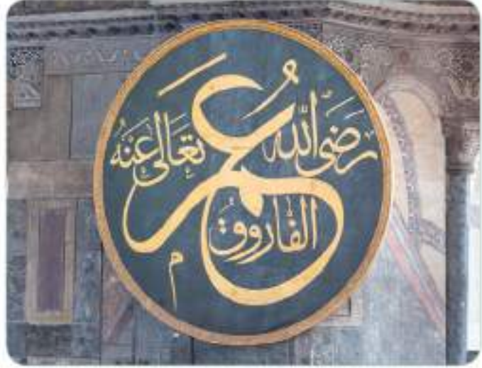
Hz. Ömer'e (r.a.) "Fâruk" lakabını, Hz. Peygamber (s.a.v.) vermiştir. (Ömerü'l-Fâruk Radlyallâhü Teâlâ anhü) yazılı bir levha (Ayasofya Müzesi)

Hz. Ömer (r.a.) küçüklüğünde çobanlık yapmış, babasına ait sürüleri otlatmıştır. Büyüyüp gençlik çağına geldiğinde ise Mekkelilerin çoğu gibi ticaret yapmıştır. Hz. Ömer (r.a.) bir keresinde Dacnan denilen yere uğradığında, çocukluk yıllarıyla ilgili olarak şöyle demiştir: "Kendimi bu mekânda (Dacnan'da), babam el-Hattab'ın sürülerini otlatırken hatırladım..." 2