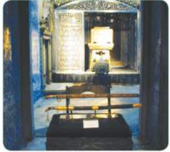
Peygamberimizin (s.a.v.) kılıcı, İstanbul'da Topkapı Sarayı Müzesinde sergilenmektedir.

Hız. Peygamber (s.a.v.), son olarak Hız. Osman'ı (r.a.) elçi olarak Mekkelilere gönderdi. Kureyşliler Hız. Osman'a (r.a.) yakın ilgi gösterdiler. Ona, isterse güvenli bir şekilde Kâbe'yi tavaf edebileceğini söylediler. Ancak Hız. Osman (r.a.), "Ben, Hız. Peygamber (s.a.v.) tavaf etmeden asla tavaf yapmam." diyerek bu teklifi reddetti. Bu duruma öfkelenen Mekkeliler, Hız. Osman'ı (r.a.) yanlarında tuttular ve onu şehirden bir süre ayırmadılar. Bu olaylar olup bitirken Müslümanlara, Hız. Osman'ın (r.a.) şehit edildiği şeklinde söylentiler ulaştı. Hız. Peygamber (s.a.v.) bu duruma çok kızdı. Şehit edilmiş olmasa bile Mekkelilerin, kendilerine elçi olarak gönderilen Hız. Osman'a (r.a.) yaptıkları çok çirkindi. Bunun üzerine bütün Müslümanlar, Allah yolunda canla başla mücadele edeceklerine, bu uğurdan hiçbir fedakarlıktan kaçınmayacaklarına dair Peygamber Efendimize (s.a.v.) söz vererek biat ettiler. İslam tarihinde bu olaya Rıdvan Biatı (Biat-ı Rıdvan) adı verilir.