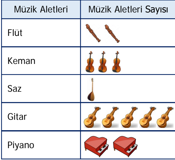
Tablo: Müzik Aletleri

Not: Her nesne 3 müzik aletini göstermektedir.