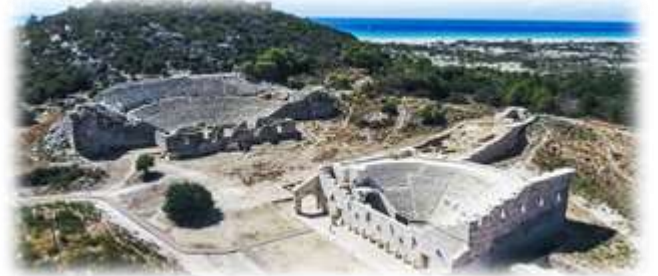
(Patara Antik Kenti)

Mustafa Kemal Atatürk'ün "Şüphesiz ki Antalya, Dünya'nın en güzel yeridir." diyerek övdüğü Antalya, ülkemizin güneyinde, Akdeniz'in kıyısındadır.