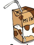
Süt 1 TL

*En pahalı ürün .....tür. *En ucuz ürün .....dir.