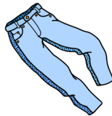
Pantolon 50 TL