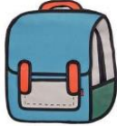
Çanta 20 TL

* .....in fiyatı sütün fiyatından ucuz, sakızın fiyatından pahalıdır.