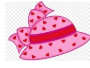
Şapka 15 TL

*En pahalı eşya .....dir. *En ucuz eşya .....tır.