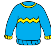
Kazak 30 TL

*En pahalı giysi .....dur. *En ucuz eşya .....tır.