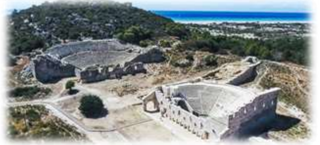
(Patara Antik Kenti)

ya'da kale, cami, saat kulesi, köprü gibi birçok tarihi yapı da bulunur.