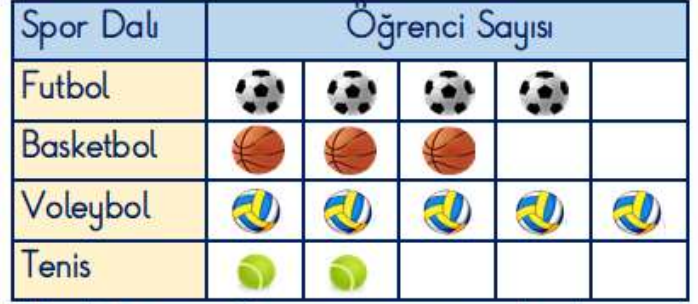
Grafik: 3/D Sınıfında Oynanan Spor Dalları

Not: Her nesne 3 öğrenciyi göstermektedir.