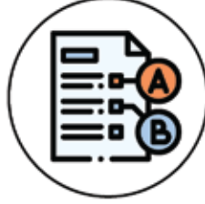
Sınav - İmtihan