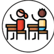
Öğrenci - Talebe