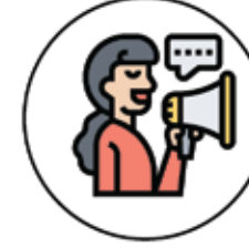
İlan - Duyuru