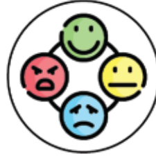
Duygu - His