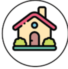
Ev - Konut