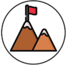
Zirve - Doruk