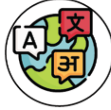
Dil - Lisan

Doktor - Hekim Misafir - Konuk Kuvvetli - Güçlü Kafa - Baş Deri - Cilt Oy - Rey Yemek - Aş Anıt - Abide Acele - Çabuk Acemi - Toy Aciz - Gücsüz Ad - İsim Adet - Sayı Bilgin - Alim Fakir - Yoksul Zengin - Varlıklı