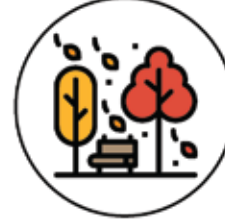
Sonbahar - Güz