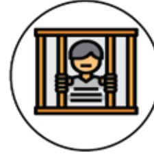
Esir - Tutsak