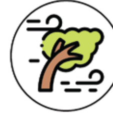
Rüzgar - Yel