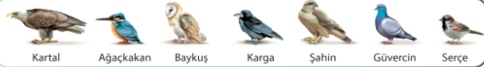
Kartal Ağaçkakan Baykuş Karga Şahin Güvercin Serçe

Bu varlıkların ortak adı, yani tür ismi meyvedir .