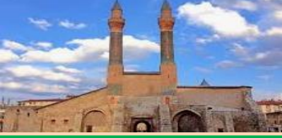
İshak Paşa Sarayı