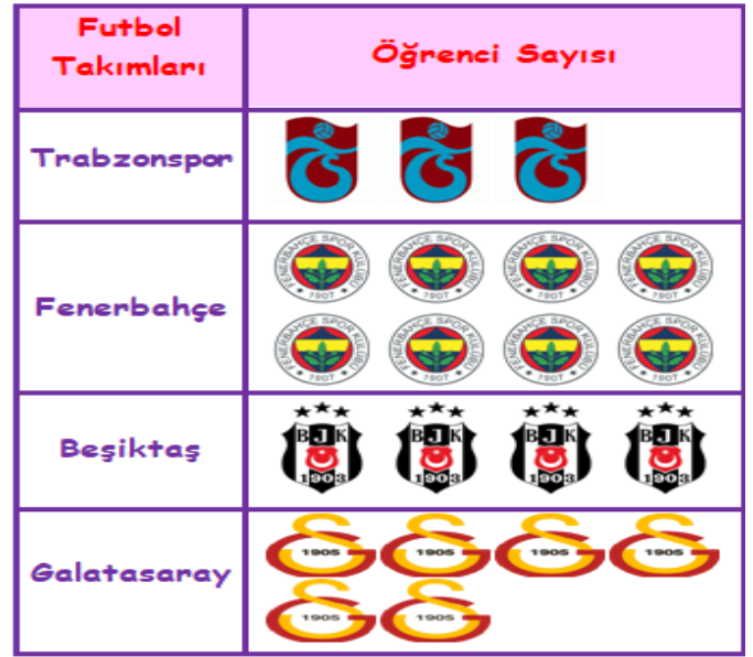
Tablo: 1/A Sınıfı En Sevilen Futbol Takımları

NOT: Her şekil 1 öğrenciyi göstermektedir.