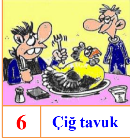
6 Çığ tavuk