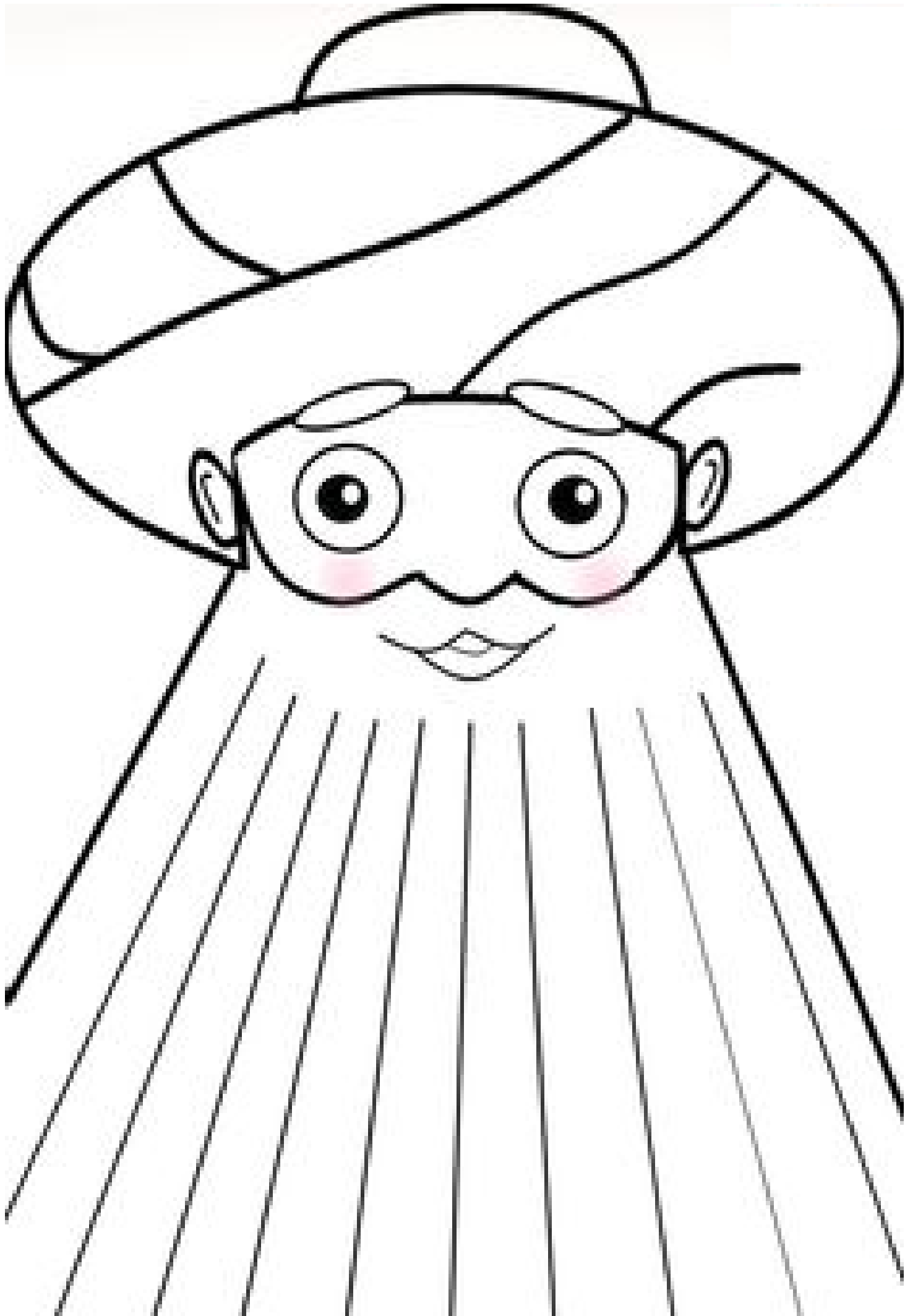
Keselim ve Sakalları Kıvıralım