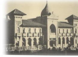
İstanbul Harp Okulu