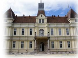
Selanik Askeri Lisesi (İdadisi)

B-) Aşağıda Atatürk'ün gittiği okullar karışık olarak verilmiştir. Atatürk'ün gittiği okulları sırasıyla numaralandırınız.