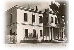
Şemsi Efendi Mektebi