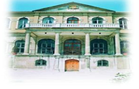
Selanik Askeri Rüştiyesi