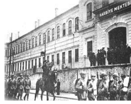
İstanbul Harp Akademisi