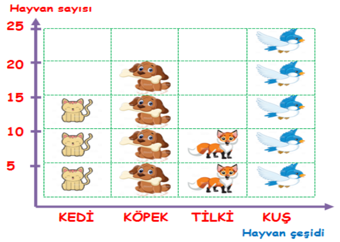
Ormandaki Hayvanların Nesne Grafiği

NOT: Her şekil 5 hayvanı göstermektedir.