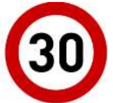
Azami Hız 30 km