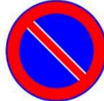
Park Yapmak Yasaktır