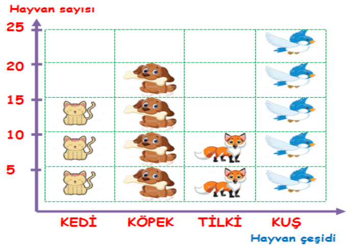
Ormandaki Hayvanların Nesne Grafiği

NOT: Her şekil 5 hayvanı göstermektedir.