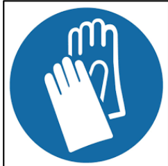
Koruyucu Eldiven Kullanın