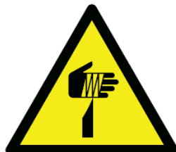
Delici ve Kesici Madde