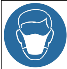
Koruyucu Maske Kullanın

*Her maddeyi duyu organlarımız ile algılamak tehlikeli olabilir.