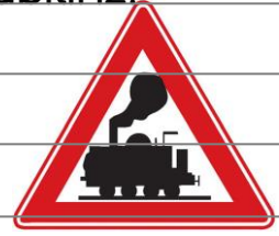
Kontrolsüz demir yolu geçidi

Tehlike uyarı işaretleri: Kara yollarını kullanan yayaları ve sürücüleri tehlikelere karşı uyarır. Tehlike uyarı işaretleri genel olarak üçgen şeklinde olur.