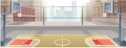
iki pota arası