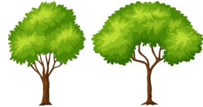
iki ağaç arası