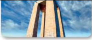
Çanakkale Şehitler Abidesi