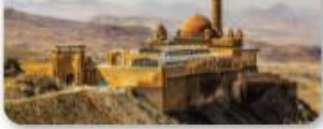
İshak Paşa Sarayı