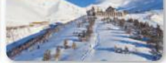
Palandöken Kayak Merkezi