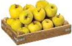
1 kasa elma