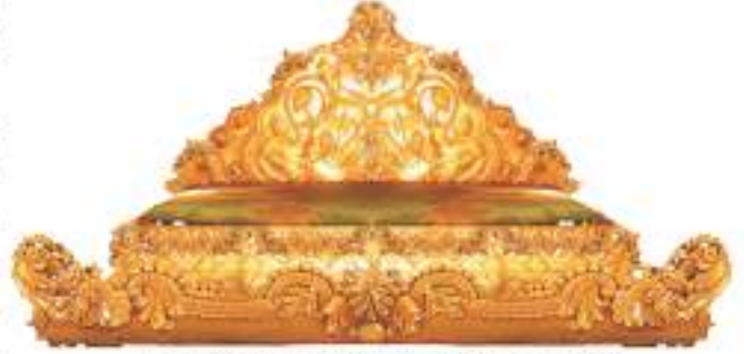
Hz. Süleyman Peygamber'in temsili tahtı.

çisi gelmeden Hüdhüd ulaştı ve: "Belkıs'ın elçisi birçok hediyeyle sana geliyor." dedi. Bunun üzerine Süleyman (a.s.) Belkıs'ın elçisine saltanatının büyüklüğünü ve Allah'ın kendisine verdiği nimetleri göstermek istedi. İnsanlara ve cinlere, elçinin karşılanacağı yerlerin süslenmesini emretti. Muhteşem bir yer hazırlattı. Hz. Süleyman geçip tahtına oturdu. Çevresinde birçok insan toplanmıştı. Kuşlar da onu gölgelemek için etrafında idiler,