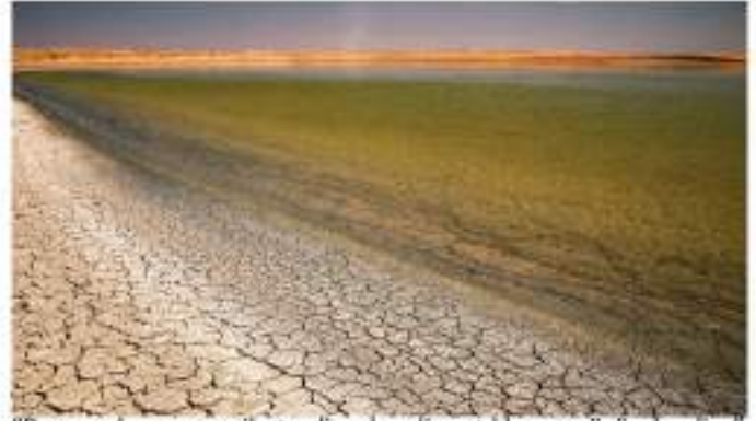
"Başınıza her ne musibet gelirse kendi yaptıklarınız yüzündendir..." (Şura suresi, 30. ayet)

Bünyamin'i de yanlarına alan kardeşler Mısır'a gitmek için yola koyuldular. Babalarının tavsiyesi üzerine farklı kapılardan şehre girdiler. Vezirin huzuruna çıktılar. Hız. Yusuf (a.s.), Bünyamin'i görünce çok sevindi ve onlara hissettirmeden onu bağrına basarak; "...Ben senin kardeşin Yusuf'um. Onların yaptıklarına sakın üzülme!" 76 Bünyamin de, onun, kardeşi Yusuf (a.s.) olduğuna iyice kanaat getirmişti.