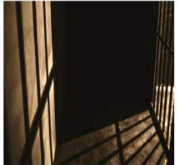
"Hz. Yusuf sabırla zindandan çıkarılmayı bekledi." (Temsili resim)

Bir kaç gün sonra vezir suçsuz olduğunu bildiği halde onu hapse attirdi. O, artık kuru bir iftiraya da uğramıştı. Zindanda bulunanlar onu tanıyınca suçsuz ve masum olduğunu anlamışlardı. Hz. Yusuf'un (a.s.) bilgili ve şerefli bir genç olduğunu, şefkat dolu bir kalp taşıdığını görmüşlerdi. Onun doğru bir inanca ve temiz bir ahlâka sahip olduğunu görmüşler,