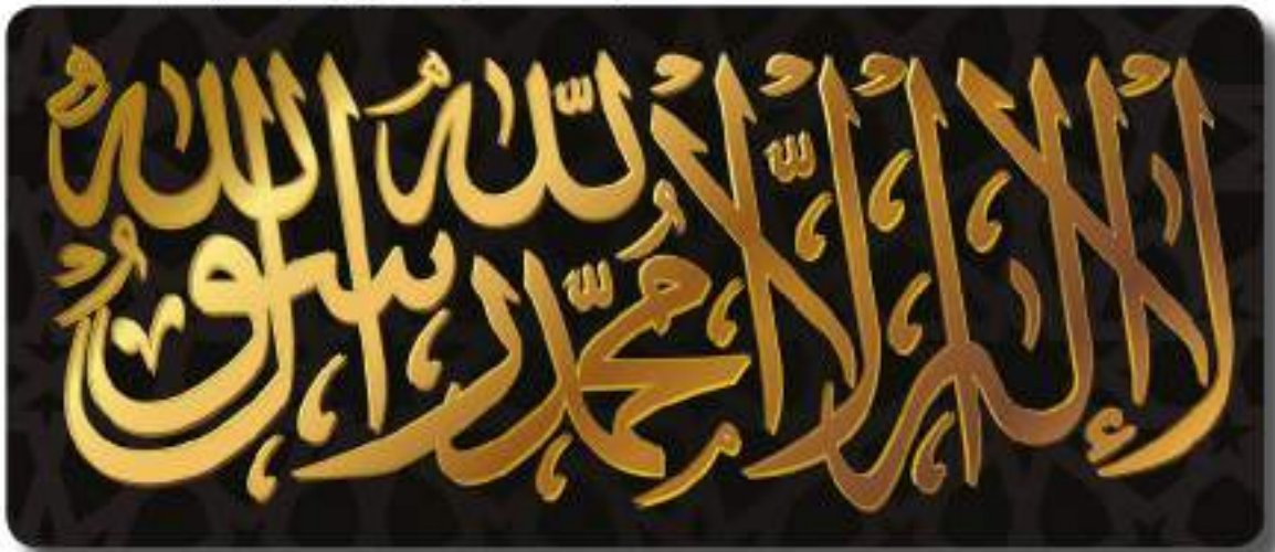
"Kalime-i Tawhid: Lâ İlähe İllallah Muhammedür Rasûlüllah"

Peygamberlik kavramıyla ilgili olarak bir diğer konu mucizedir. Mucize; peygamberlerin kendilerine inanmayan insanlara peygamberliklerini ispat etmek amacıyla Allah'ın (c.c.) iznine bağlı olarak gösterdikleri olağanüstü olaylardır. Burada dikkat edilecek husus, mucizenin peygamberin yetkisinde olan bir unsur değil de Allah'ın (c.c.) izniyle gerçekleşen bir olay olmasıdır.