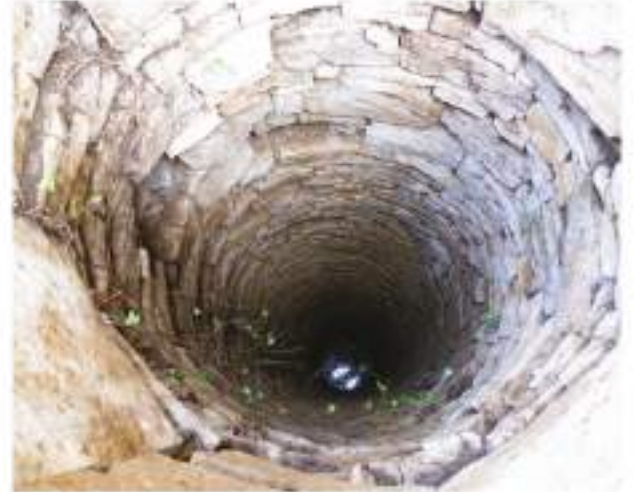
Hz. Yusuf kardeşleri tarafından bir kuyuya atılmıştır.

Hz. Yakup (a.s.) söylenenlere hiç inanmamıştı. Gömlek hiç de kurt tarafından parçalanmışa benzemiyordu fakat başına gelene katlanacaktı. Oğullarına yönelerek; “...Bilakis nefisleriniz size (kötü) bir işi güzel gösterdi. Artık (bana düşen) hakkıyla sabretmektir. Anlattığınız karşısında (bana) yardım edecek olan, ancak Allah’tır.” 52 diye sözlerini tamamladı.