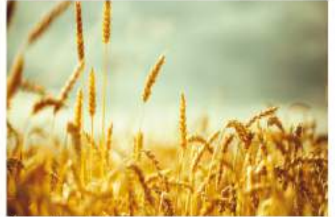
"Görmediler mi ki biz yağmuru kupkuru yere gönderip onunla hayvanlarının ve kendilerinin yiyeceği ekinler çıkarınız..." (Secde suresi, 27. ayet.)

Zindan arkadaşı bu yorumu hemen krala haber verdi. Kral çok beğenmişti. Zindanda unutulmuş Yusuf'u (a.s.) hemen çağırarak; "Onu bana getirin!" dedi.