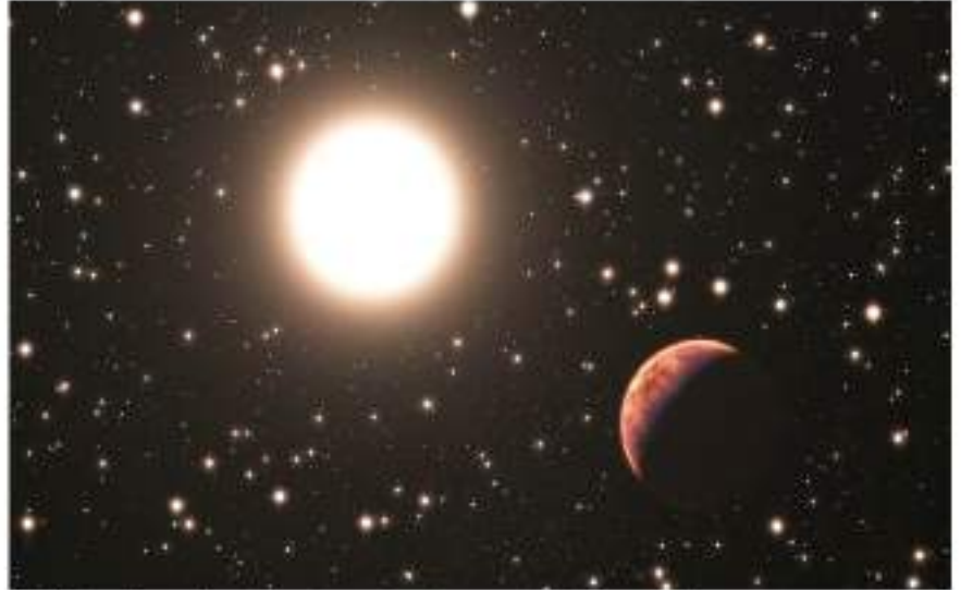
"O, düzen üzere hareket eden güneşi ve ayı sizin hizmetinize sunan, geceyi ve gündüzü sizin emrinize verendir." (İbrahim suresi, 33. ayet.)

Yusuf, babasının anlattıklarını dikkatle dinledi. Bir an üvey kardeşlerinin kendisine ve küçük kardeşi Bünyamin'e olan kıskançlıklarını ve kötü davranışlarını hatırladı. Babası uyardığı için onlara karşı dikkatli olmalı ve rüyasını da anlatmamalıydı.