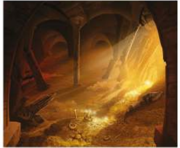
Zindandan çıkan Hz. Yusuf (a.s.) Mısır'ın veziri oldu. (Temsili resim)

Yusuf'a (a.s.) istediği verildi. O, artık bir vezirdi. Mısır'ın maliye veziri idi. Doğruluğunun, iffetinin ve sabrının mükâfatını görmüştü. Peygamberliği yanında devlet yönetiminde söz hakkına sahip olmuştu. Sonuçta bir gerçek vardı: Allah (c.c.) mazlumların yanındaydı ve doğruların yardımcısı idi. Yeter ki sabredilsin; ilim, hikmet ve akıl ile mücadele ederek sağlam bir iradeye sahip olunsun.