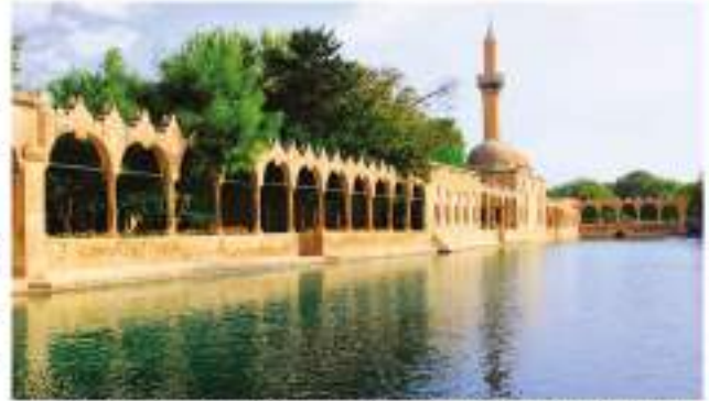
"Hz. İbrahim'in ateşe atıldığı yer olarak rivayet edilen Balıklıgöl/Şanlıurfa"

Hz. İbrahim'in (a.s.) ateşe atılmasını, ateşin onu yakmamasını ve Hz. İbrahim'in (a.s.) duasını tevhid inancı çerçevesinde arkadaşlarınızla tartışınız.