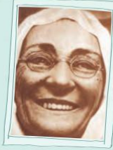
Mustafa Kemal'in annesi Zübeyde Hanım