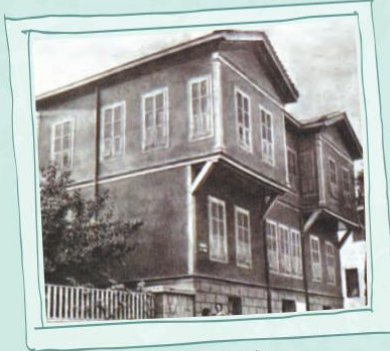
Mustafa Kemal'in doğduğu ev