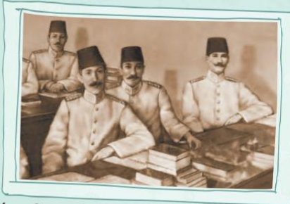
Mustafa Kemal Harp Akademisinde arkadaşlarıyla (ön sırada en sağda)