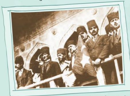
23 Nisan 1920 günü Büyük Millet Meclisi açılış töreninden sonra Mustafa Kemal Paşa, Meclis balkonundan Ankaralıları selamlarken