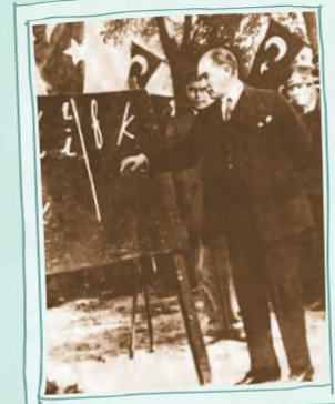
Mustafa Kemal, Sivas'ta yeni Türk alfabesini halka öğretirken