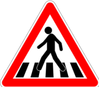
Tanzim ( düzenleme) İşaretleri

C) Aşağıdaki trafik işaret ve levhalarını anlamına uygun olarak eşleştiriniz.( 4'er Puan)