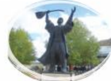
Pir Sultan Abdal