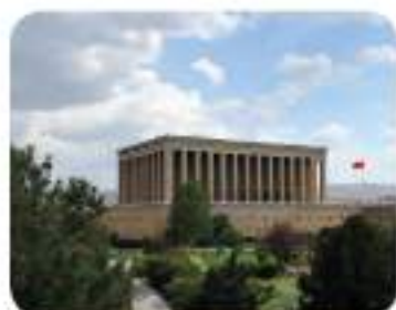
Mauzolej Mustafe Kemala Ataturka