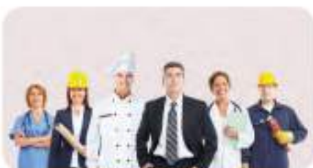
Traži se radnik