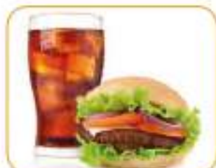
hamburger i kola