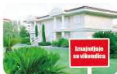
Iznajmljuje se vikendica

Iznajmljujem svoju četverosobnu vikendicu u Mostaru. Ona je renovirana i namještena. Nalazi se u centru grada.