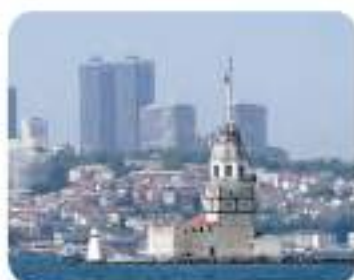
Djevojačka kula (Kız Kulesi)