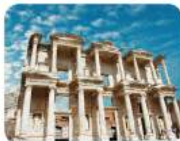
Antički grad Efes