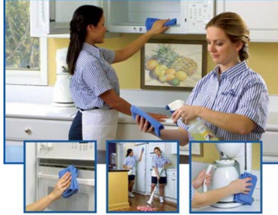
FOTOĞRAF 1.4: Ev ve kurum hizmetleriyle ev ve kurumların temizliğini yaparak sağlıklı mekânlar hâline getirme