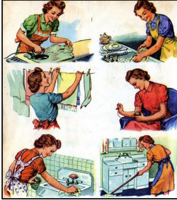
Resim1.1: Ev ve kurumlarda verilen hizmetler

Ev sadece maddi unsurlardan ibaret değildir. Ev, içinde barındırdığı bireylerle ve eşyalarla bir bütündür. Ev yönetimi bu bütünü amaçlar. Bu özellikleri ile ev yönetiminin amaçları toplumdan topluma, aileden aileye değişebilir. Ancak herkes için geçerli olacağı düşünülen amaçlar şunlardır: