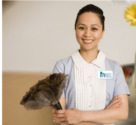
Fotoğraf 1.8: Ev ve kurum hizmetleri elemanının güler yüzlü ve sempatik olması