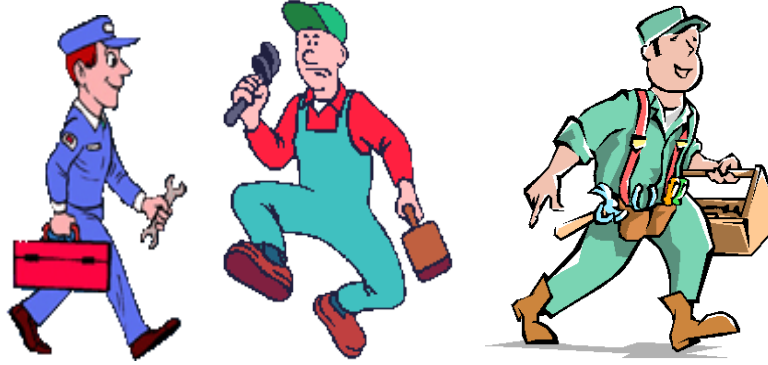
Resim 2.1: Bakım onarım elemanları

Kullandığımız ev araçlarında ve parçalarında zamanla bazı arızalar, bozulmalar, yıpranmalar ve kırılmalar oluşabilir. Bu gibi durumlarda alınması gereken önlemler şunlardır: