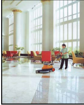
Resim:1.10: Ev ve kurum hizmetleri elemanının tatil köyü, otel, motel, konuk evi, vb. konaklama hizmeti veren kuruluşlarda çalışması