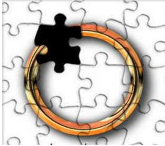
Resim 2.5: Eş seçiminde kararsızlık

Bu grupta yer alan kişiler güvensiz, aşırı kuşkulu, ihtiyaçlarının giderileceğine inanamayan, kısa sürede ilişkilerinden usanan özellik gösterirler. İkili ilişkilerde karşısındaki bireye beklediği huzuru, sevgiyi ve bağlılığı veremezler.