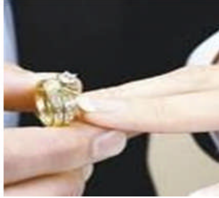
Resim 3.2: Evlilik için ciddi bir adım olan nişanlılık

Nişanlılık, toplumumuzda yasal olduğu kadar gelenek ve göreneklere göre de herkes tarafından kabul edilen bir dönemdir. Çiftler kararlaştırılan biçimde düzenlemiş bir törenle nişanlandıklarını yakın akraba, arkadaş ve çevrelerine duyururlar. Nişanlılık, evlilik için ciddi bir adımdır.