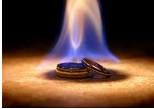
Resim 3.17: Problem çözmeye bakış açısının önemi