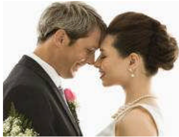
Resim 3.3: Nişanlılık, evlilik kararı için sorumluluk yüklü bir dönem

Nişanlanmadan önce çiftler, birbirini uzun süreden beri tanışmalar bile nişanlılık, evlilik kararı alan çiftler için yeni ve sorumluluk yüklü bir dönemdir. Hangi açıdan bakılırsa bakılırsa nişanlılık, geleceğin eşlerine ciddi biçimde birbirini inceleme ve evlilik için uygun olup olmadığını saptama olanağı vermektedir. Ayrıca birbirinin değerleri, standartları, gelenekleri, göreneklere ve alışkanlıklarını öğrenirler. Evliliği sağlam temeller üzerine kurma işlevine katkısı olan bir dönemdir.