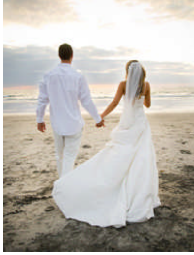
Resim 3.7: Balayı, çiftlerin her şeyden uzak baş başa geçirdikleri ilk zamanlar

Balayı planlanırken göz önünde bulundurulması gereken hususlar: