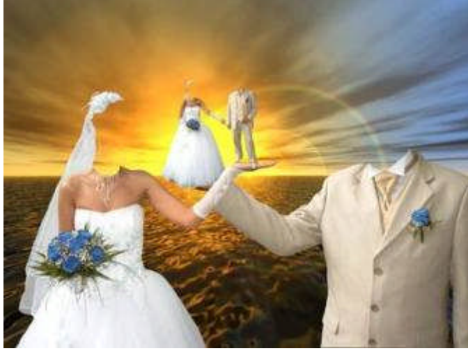
Resim 3.6: Evliliđin ilanı olan evlenme trenleri

katılmaları sađlanmıř olur. Tarih saptanırken dđđün iin en uygun yıl, mevsim, ay ve gn dikkate alınarak her iki tarafın yakınlarının ve eř adaylarının uygun zamanları belirlenmelidir. Ayrıca dđđnn nerede ve nasıl yapılacađı da dřnlmelidir.