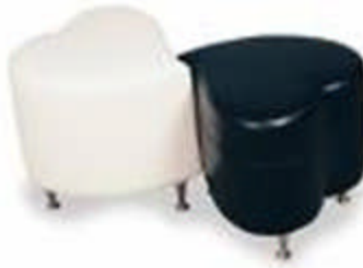
Resim 1.3: Arkadaşlık ilkelerinin iki farklı yönü

Evlilik öncesi arkadaşlık ilişkileri ölçülü, saygılı, etkili bir iletişim ve etkileşim ortamında yürütülmelidir. İlişkilerin gergin ve duygusal olması tarafların incinmesine, birbirine olan güvenin azalmasına ve olumsuz görüşlerin ortaya çıkmasına neden olabilir. Her arkadaşlık, evlilikle sonuçlanmayacağına göre ilişkilere dikkat ve özen gösterilmesi gerekmektedir.