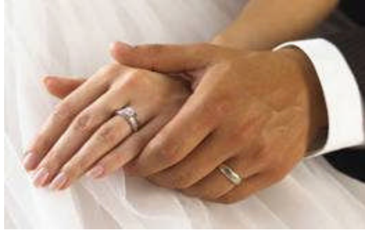
Resim 2.2: Evlilik birlikteliğine atılan ilk adım olan söz

Söz kesmek, geleneklere göre iki aile arasında evlilik ilişkisini başlatan "sözlü bir anlaşma" ve bu ilişkinin topluma ilan edilmesi geleneğidir.