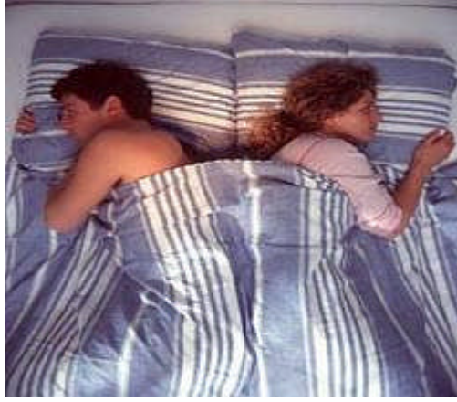
Resim 3.14: İlişkilerin sağlıklı yürütülmesinde sorunların ertelenmeden konuşulmasının önemi

Cinsel yaşam, hukukun ve toplumun aile kurumunda eşlere tanıdığı beraberliğin sonucu doğal bir etkileşimdir. Bu konuda sorun çıkmaması için eşlerin doğru bilgilerle eğitilmesi, ilişkilerin karşılıklı doyum sağlanacak biçimde düzenlenmesi gerekir. Sorunların ertelenmeden konuşulması, tanımlanması ilişkilerin sağlıklı yürütülmesinde etkilidir. Çözümü bulunamayan sorunlarda uzmanlara başvurulmalıdır.