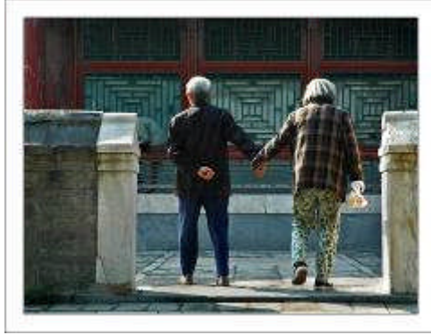
Resim 2.13: Kronolojik olgunluk (bireyin takvim yaşının evlilik için uygun olması)