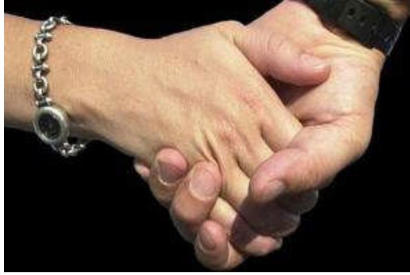
Resim 3.11: Eşlerin güçlü dayanışması ile devam eden başarılı evlilikler

Dayanışma bireylerin kendilerini güven içerisinde, huzurlu ve mutlu hissetmeleri, karşılaştıkları sorunlarda yalnız olmadıklarının farkında olmalarıdır. Dayanışmanın ön koşulu paylaşmadır. Bireylerin umut ve beklentilerinin karşılanması, dayanışmanın oluşması ve sürdürülmesinde en önemli etkenlerden biridir. Evliliğin ilk yılları, dayanışmanın kurulması ve gelişmesi açısından önemlidir.