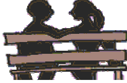
Resim 1.1: Hem kendini hem de karşıdakini tanıma fırsatı veren arkadaşlık

olamaz. Bu kořullarda sürdürülen arkadaşlıklarda bireyler, birbirini gerçek anlamıyla tanıyamazlar.