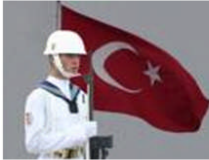
Resim 2.17: Ülkemizde askerlik yapmakla yükümlü olan gençler

Ülkemizde olgunlaşmakta olan erkekler için belirli bir süre askerlik yapmak yasal bir yükümlülüktür. Bu dönem, genellikle erkeğin evlenebilecek olgunluđa eriştiđi zamana rastlar. Evlilik kararını almak için bu sürecin tamamlanmış olması, evlilik için gerekli şartların tamamlanması açısından önemlidir.