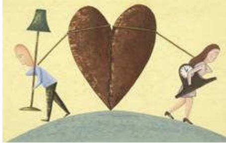
Resim 3.19: Boşanmanın da sosyal ve yasal bir olay olması tıpkı evlilik gibi

Boşanma, her bireyde sonuçları farklı etkiler yaratmaktadır. Bu sürecin sonunda eşlerden her biri çocukların velayetinin belirlenmesi, yeni sosyal faaliyetlere katılma güçlüğü, kendi kendine yetememe endişesi, güvensizlik, yalnızlık gibi sosyal ve psikolojik sorunların çözümünü aramak zorunda kalmaktadır. Sorunların çözümünde ilgili kurum ve kuruluşlardan destek hizmeti almak bireylerin yeni hayatlarına uyum sürecini kolaylaştırır.