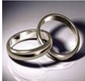
Resim 3.8: Evlilik birliğinin simgesi alyans

Balayı, nişanlılık ve evlilik arasında bir geçiş özelliği taşımaktadır. Ne kadar iyi planlanır, kurulur ve yürütülürse evlilik o kadar sağlam temellere oturur.