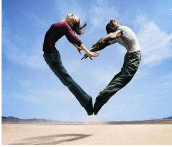
Resim 2.16: Evliliđi güçlü, ilişkileri dengeli ve uyumlu kılan duygusal olgunluk