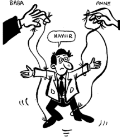
Resim 2.8: Evlilik kararında anne babanın rolü