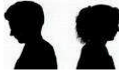
Resim 3.10: Her evlilikte çatışmanın olması

İlişkilerin devamlı çatışma ortamında devam ettiği bir evlilik, uyumsuz olarak kabul edilir. Çatışmanın her evlilik birlikteliğinde olması normaldir. Önemli olan şiddete dönüşmemesi, alışkanlık hâline gelmemesi için önlem almaktır. Çatışmanın nedenlerini tespit etmek ve ortadan kaldırmak için çaba sarf etmek gerekir.