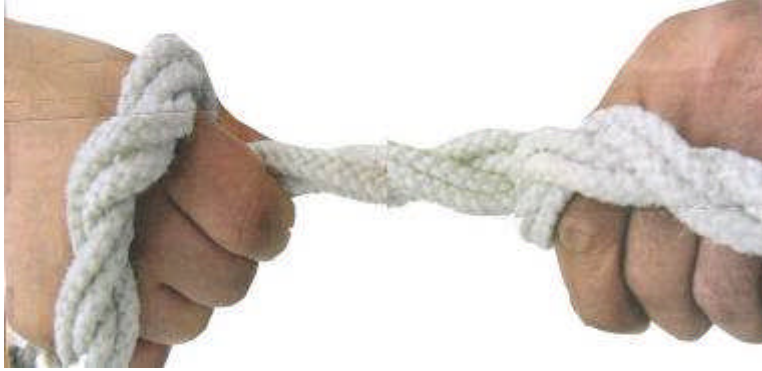
Resim 2.3: Sosyoekonomik düzeyin yaşam biçiminde etkili olması

Her birey, içinde doğup büyüdüğü ve geliştiği sosyoekonomik koşulların bir ürünüdür. Farklı sosyoekonomik gruplar, para ve kültürel konularda farklı görüşlere sahip olur. Evlilik kararı alan çiftlerin sosyoekonomik düzeyleri birbirine ne kadar yakın olursa sorunların çözümü de o derece kolay olmaktadır.