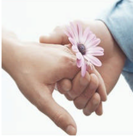
Resim 1.5: Tanıma ve onura layık bulma insana verilebilecek en önemli armağan

Her insan takdir edilme, farkına varılma ve saygı görme ihtiyacı hisseder. İlişkilerde saygı bekleminin temelinde, insanın kendine duyduğu saygı vardır. Bu temele dayanan birliktelikler, sağlıklı ve uzun ömürlü olur.