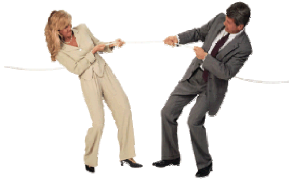
Resim 3.13: Çatışma nedeni olan otoriteyi kullanma

Sosyal bir kurum olan evlilik birlikteliğinin yönetimi, diğer kurumlara göre farklılık göstermektedir. İlişkiler, yazılı kesin kurallara bağlı değildir. Otorite, başkalarının davranışlarına yön verecek kararları verme gücüdür. Evliliklerde otoritenin kimde olacağını belirleyen en önemli nokta, eşlerin bilgi ve beceri birikimleridir. Evlilik birlikteliğinde otorite, her konuda herkese her istediğini yaptırabilme gücü olarak kabul edilmemelidir.