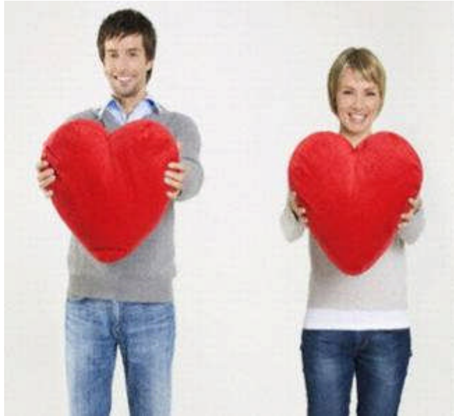
Resim 1.2: İdeal tipin belirlenmesinde arkadaşlık

Evlilięi düşünmeye başlayan bireyler için arkadaşlık, bir "arayış" dönemidir. Bu dönemde bireylerin "ideal eş" tipi şekillenmeye başlar ve bireyler evlenecekleri kişide aradıkları özellikleri, asla evlenmek istemedikleri karakterleri tanımlarlar. Evlilik öncesi yapılacak arkadaşlıklar hem bu "ideal tipin niteliklerinin belirlenmesi" hem de "bulunması" açısından yararlıdır. "İdeal tip" kavramı göreceli bir kavramdır. Herkese uygun ideal bir tip yoktur, ideal tip kişilere göre deęişir. Bireyler, ideal tiplerini kendileri oluştururlar. Evlilik öncesi arkadaşlıklara, her ilişkinin evlenme ile sonuçlanmayacağını düşünerek yaklaşmak yaşanabilecek hayal kırıklıklarını engeller.