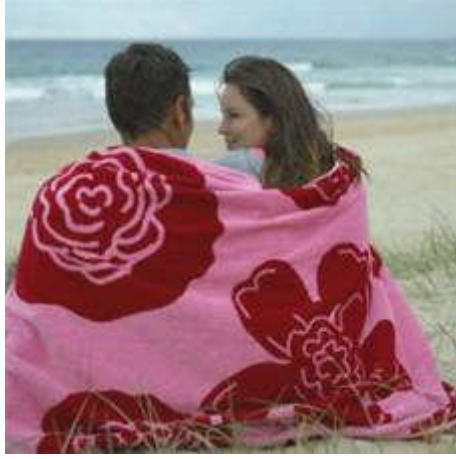
Resim 1.6: Büyük duygusal etkileşimin sağlanmasında etkili olan küçük fedakârlıklar