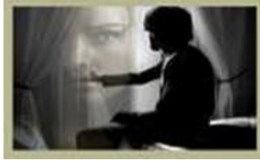
Resim 2.12: Evlilik kararını etkileyen geçmişin izleri

Bazı bireyler, geçmişte âşık oldukları kimseyi her türlü kusurdan uzak bir kişiliğe dönüştürür ve başkasının onun yerini alabileceğine inanamaz. Evlilik için bütün olanakları reddeder.