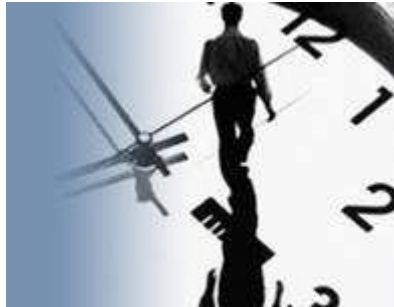
Resim 2.7: Dengesiz yaşamların evliliğin birliğini zedelemesi

Evlilik için uygun olmayan bir başka kişilik tipi ise işinden başka şey düşünmeyen, sürekli çalışmak zorunda olan ya da öyle olduğunu öne sürenlerdir. Bu durumda bireyler birbirini görebilmek için fırsatlar yaratmakta zorlanırlar, dengesiz bir yaşam evlilik ilişkilerini zora sokar.