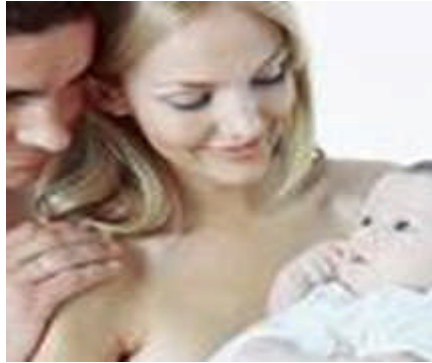
Resim 2.14: Tek başına evlilikte yeterli olmayan fiziksel olgunluk

Bireylerin, evliliğin gerektirdiği iş yapabilme gücünü kazanması için vücut kasları, kemikleri ve diğer bütün vücut sistemlerinin gelişmesi gerekir. Fiziksel olgunluk, aynı zamanda çocuk yapabilir duruma gelmektir.