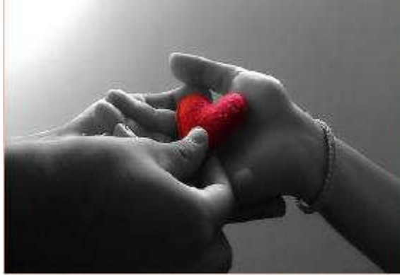
Resim 3.1: İlişkilerde akıl ve duygusallık dengesinin korunması

Berberliklerin kabul görmesi ve toplum tarafından onaylanması için bireylerin birlikteliklerini, evlilik kurallarıyla onaylatması gerekir. Bireyler yalnızlıktan kurtulmak, ekonomik koşullarını iyileştirmek, çocuk sahibi olmak, cinsel doyum sağlamak ve toplumsal yaşamın gerekliliği olarak evlilik kararı verirler. Bu kararın aşamaları, bireylerin yaşadıkları toplumun gelenek ve göreneklerine göre değişkenlik gösterir.