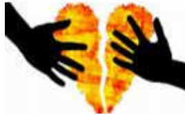
Resim 3.16: Sorunların çözülemeyecek derecede yoğunlaşması ve ilişkilere zarar vermesi

Bireyin beklenmedik bir zamanda istenmedik bir olayla karşılaşması, kendisini yetersiz hissetmesi, karşılaştığı problemleri kendi gücüyle çözemeyeceğine inanması bunalımlı bir dönem yaşadığının işareti olarak kabul edilir. Evliliklerde bunalım ise sorunların çözülemeyecek derecede yoğunlaşması, bireylerin fiziksel ve duygusal sağlığını bozacak duruma gelmesi şeklinde açıklanmaktadır.