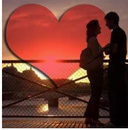
Resim 1.8: Eş adaylarının farklılık ve benzerliklerini ayırt edebilmeleri