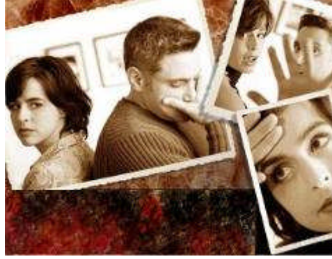
Resim 3.18: Küçük problemlerin çözümleri ertelendikçe aşılması zor engellerin evlilikte çözülmeyi hızlandırması