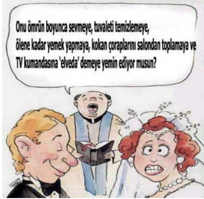
Resim 2.15: Bireylere cinsiyetlerine göre sorumluluklar yükleyen törel olgunluk