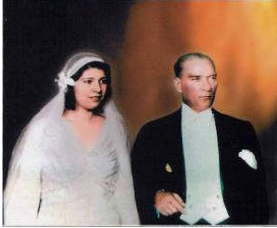
Resim 3.5: Evlilikte resmi nikâh için de halkına örnek olan Atatürk

alır. Aile birliđi, evlilik bađının kurulmasını öngörmektedir. Bir kadınla bir erkeđin arasında yasaların düzenlediđi ve kabul ettiđi yařama birliđine “evlilik bađı” denir.