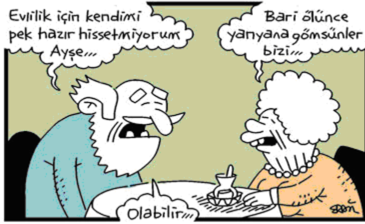
Resim 2.6: Karar vermeyi olumsuz yönde etkileyen etmenlerden birisi de evlilikten korkmak