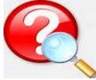
Resim 3.12: Sorunların iyi analiz edilerek çözümün kolaylaştırılması

Evliliklerde uyumsuzluk yaratan, dayanışmayı engelleyen durumlar zamanla sorun yaratan konular hâline gelir.