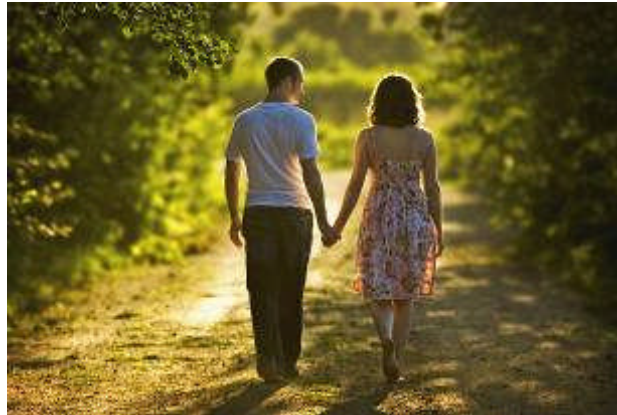
Resim 1.4: İnsanın en önemli ihtiyaçlarından biri sevgi

Bireylerin en önemli ihtiyaçlarından biri olarak kabul edilir. İnsanı bir şeye veya bir kimseye karşı yakın ilgi ve bağlılık göstermeye yönelten duygu olarak tanımlanır. Sevgi taraflara her şeyden önce güven, rahatlık ve huzur verir. Bireylerin başkalarına karşılık beklemeden yardım etme, iyilik yapma, yararlı olma, hoş olmayan ya da istenmeyen yönleri görmezlikten gelme gibi duygu ve düşüncelerinin altında hissettikleri sevgi vardır.