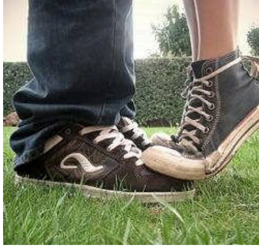
Resim 1.7: Karşılıklı etkileşimde empati

Bir iletişim becerisidir. Bu beceri, kişileri başkalarının istek ve ihtiyaçlarını anlamaya yönlmesi bakımından yararlıdır.