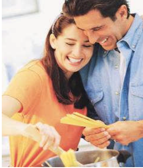
Resim 3.9: Eşlerin karşılıklı ihtiyaçlarının doyurulmasının uyum için önemi

Evlilikte uyum, eşlerin karşılıklı ihtiyaçlarını doyurucu biçimde beraberliklerini devam ettirebilmelerini ifade eder. İlgili kararları birlikte alabilen, geleceklerini birlikte planlayabilen, kaynaklarını birlikteliklerinin amaçları doğrultusunda kullanabilen çiftler uyumu daha kolay sağlamaktadırlar.