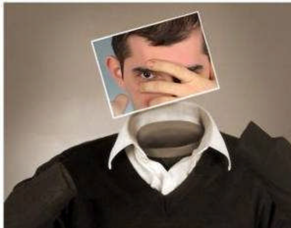
Resim 2.9: Karar vermeyi etkileyen endişeler

Ailesine ve yakınlarına karşı ekonomik sorumlulukları bulunan ve bu duruma aşırı değer veren bireyler, eşlerini ve ileride olabilecek çocuklarını idare edemeyecekleri endişesiyle evlilik kararı alamazlar.