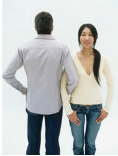
Resim 2.4: Eş seçiminde önemli olan kültürel farklılıklar

Toplumlardaki gelenekler, örf ve adetler, değer sistemi ve kurallar kişilerin davranışlarını belirleyen temel etkenlerdir. Evlenme çağına gelmiş bireylerin davranışları, bu etkenlere göre biçimlenip belirginleşeceği için ayrı uluslardan iki kişinin evlilik kararı öncesinde her konuyu açıkça konuşması, mutluluğu olumlu yönde etkiler.