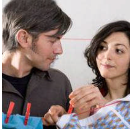
Resim 3.15: İş bölümü yapılarak eşlerin birbirine zaman ayırması