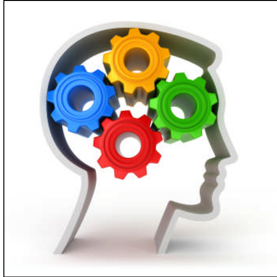
Resim.2.2: Bireylerin toplumda kararlarının isabetli olmasıyla değer kazanması

Ekonomik kararlar öncelikle en alt düzeyde yer alan fizyolojik ihtiyaçlar için alınmaktadır. Bunlar giyinme, barınma, beslenme gibi ihtiyaçlardır. Bireyler bu temel ihtiyaçlarını karşıladıklarında yeteneklerini ortaya koyma, potansiyellerini ve ideallerini gerçekleştirme, başarıları ile kendilerini ispatlama ihtiyacını hissetmektedirler.