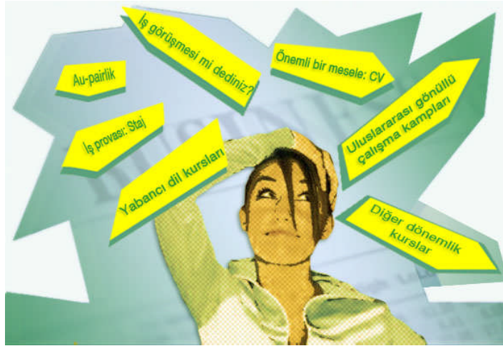
Resim.2.1: Gençlerin aynı zaman diliminde bir çok karar vermek durumunda kalması

Bireylerin kısa ve uzun sürede ulaşmak istediği bir takım amaçları bulunmaktadır. Bu amaçlar belli ihtiyaçların karşılanması içindir. Abraham Maslow'a göre insanların ihtiyaçları belli bir hiyerarşik düzendedir. Bu hiyerarşide bireylerin alt basamaktaki ihtiyacının karşılanması bir sonraki basamakta yer alan ihtiyacını güdüler. Bu hiyerarşide öncelikle fizyolojik ve onu takiben sırasıyla güvenlik, sosyalleşme, tanınma ve başarıma ihtiyaçları yer almaktadır. Karar verme uygulamaları ekonomik, sosyal ve teknik kararlar olmak üzere üç genel başlık altında toplanabilir.