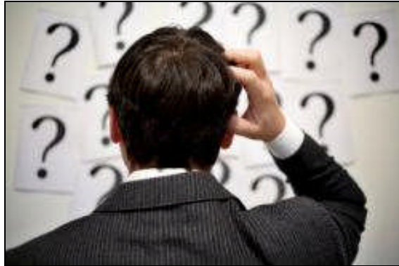
Resim.2.3: Sağlıklı özgüvene sahip kişilerin kararsızlığı fazla yaşamamaları

Karar vermeyi etkileyen etmenlerden kararsızlık oluşumu en olumsuz sonuçtur Bazı insanlar günlük yaşamında karar vermeyi gerektiren bir durumla karşılaştığında kolayca karar veremezler. Kararsızlığın ortaya çıkmasında kişilik yapısı etkilidir.