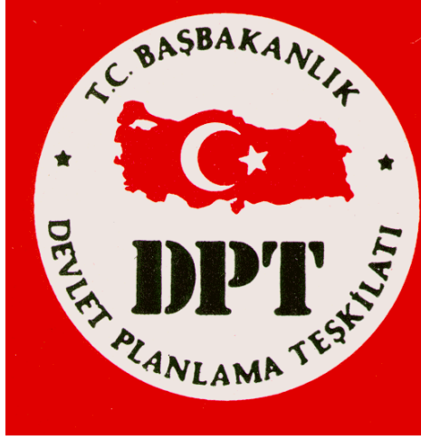
Resim.1.2: DPT kalkınma planlarını ilgili kuruluşların da görüşlerini alarak hazırlaması

Planlama, önceden belirlenmiş amaçları gerçekleştirmek için yapılması gereken işlerin saptanması ve izlenecek yolların seçilmesidir. Planlama, geleceğe bakma ve olası seçenekleri saptama ve bir eylemle ilgili tüm etkinliklerin önceden hazırlanması sürecidir yani geleceği düşünmedir. Planlamayla ilgili olarak dikkat çeken ortak nokta, planlamanın geleceği bugünden görme ve kontrol etme aracı olmasıdır. Planlamayı ekonomik anlamda bir kaynak dağıtım mekanizması olarak da görmek mümkündür.