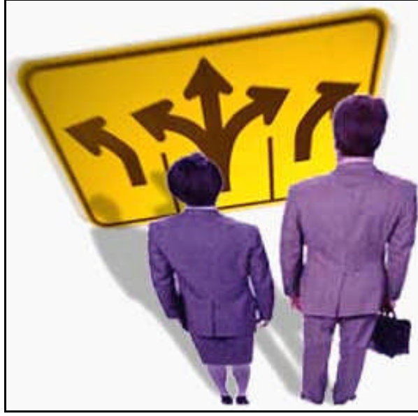
Resim 2.4: Kararsız kiřilerin seenekler iinde boęulmasına neden olunmaması