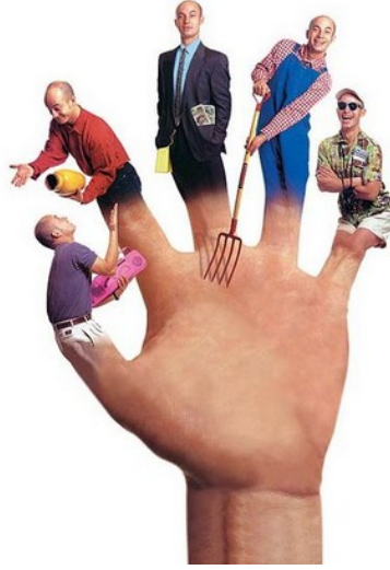
Fotoğraf 1.1: Canlı bir birim olan toplumun, sürekli yeni oluşumlar içerisinde olması

Toplumsal yapının temel öğeleri; fiziki yapı, nüfus, toplumsal ilişkiler, kültür ve toplumsal tabakalaşmadır.