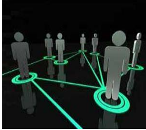
Resim.1.1: İletişim yoluyla bireylerin birbirini herhangi bir durum karşısında etkilemesi

Sosyal bir varlık olan insanın temel, fizyolojik ihtiyaçlarını karşılayabilmesi için toplumla iletişim içinde olması gerekir. İletişim kültürün oluşturduğu unsurlardan sadece biridir. Ama zamanla insanların iletişim kaynaklarına yaptığı katkılarla daha da ilerlemiş ve bugünkü durumuna kavuşmuştur. Böylece iletişim, kültürün toplumsallığını, sürekliliğini ve değişkenliğini gözler önüne seren en önemli insanlık etkinliğidir. İletişim yoluyla bilgi, düşünce, sevgi, kıskançlık, nefret vb. gibi olumlu ya da olumsuz duygular bireyler arasında paylaşılır. Yine iletişim yoluyla bireyler birbirini herhangi bir durum karşısında etkiler ya da yönlendirir.