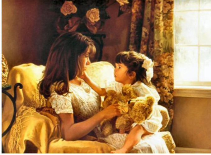
Resim 1.3: Birincil ilişkilerden aile bireyleri arasındaki ilişkiler