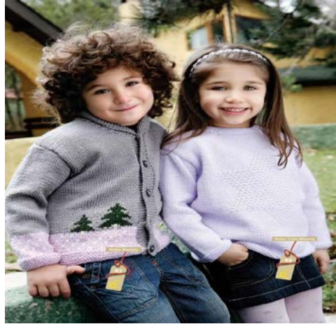
Fotoğraf.1.4: Çocukların doğuştan getirdikleri cinsiyet özelliklerinin verilmiş statülerden olması