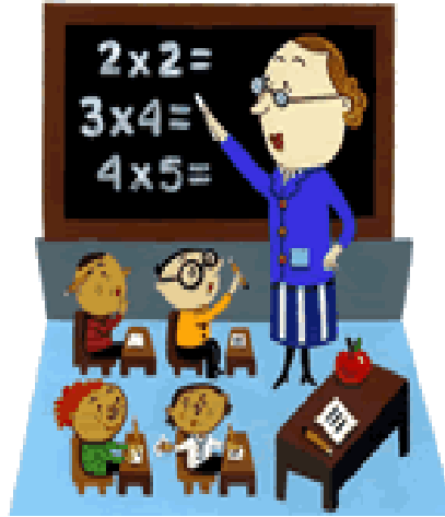
Resim 1.2: Öğretmen ve öğrencilerin statülerine uygun davranışta bulunması

Bazı roller birbirini kolaylaştırır. Buna rol geliştirmesi denir. Örneğin, bir öğretmenin sınıfta ders anlatması nedeniyle kazandığı anlatım kolaylığı, onun iyi bir ders kitabı yazmasını da olanaklı bir hale getirebilir. Dolayısıyla öğretmenlik rolü, ders kitabı yazarlığı rolünü kolaylaştırır.