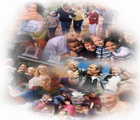
Fotoğraf.1.6: İnsan haklarının egemen değerler içinde yer alması

Toplumsal değerler, toplumsal ilişkilerden doğan davranış kalıplarına dayanırken toplumsal ilişkilere de yön verir. Çünkü toplum değerler çerçevesinde bazı davranışları onaylar ve ödüllendirir, bazılarını ise cezalandırır. Değerlerin değişmesi güçtür ve uzun zaman gerektirir.