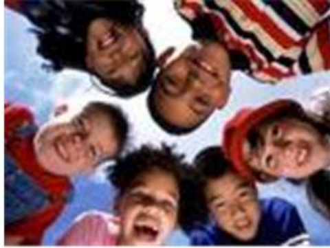
Fotoğraf.1.13: Zorunlu olmayan arkadaşlık ilişkisi