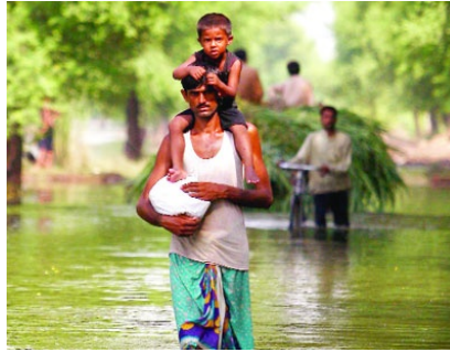
Fotoğraf.2.5: Ekonomik kaynakların azlığının yaşam biçimini değiştirmesi