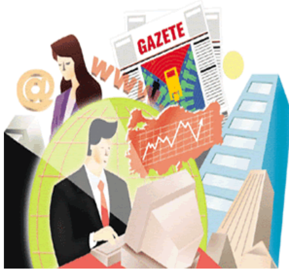
Resim2.1: Kitle iletişim araçlarının insanlar tarafından bilgi almak ve eğlenmek amacıyla kullanılması

Radyo ve televizyonla anında birtakım bilgileri uzak yerlere ulaştırma olanağı doğmuştur. Bu sayede modern toplumların gelişmiş kültürleri diğer kültürleri de etkilemekte, kültürün evrensel öğelerinde birleşme sağlamaktadır. Günümüzde insanlar kitle iletişim araçlarını eğlenme amacının yanında bilgi alma, toplumsallaşma ve önemli dünya olaylarını öğrenme gibi amaçlarla kullanmaktadırlar. Dolayısıyla kitle iletişim araçları reklam, propaganda, eğitim ve haberlendirme yoluyla insanların düşünce, inanç, kanı, tutum ve davranışlarını değiştirmektedir. Sonuçta, toplumsal yaşam değişmektedir.