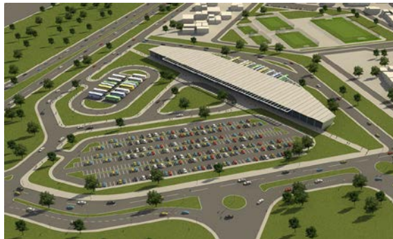
Fotoğraf 1.2: Toplumsal yapıyı etkileyen faktörlerden birinin fiziki çevre olması

Fiziki çevre, toplum yaşamını etkilemektedir. Fakat günümüz insanı da fiziki çevre üzerinde etkili olabilmekte, gelişen teknoloji nedeniyle çevresini geniş çapta değiştirebilmektedir.