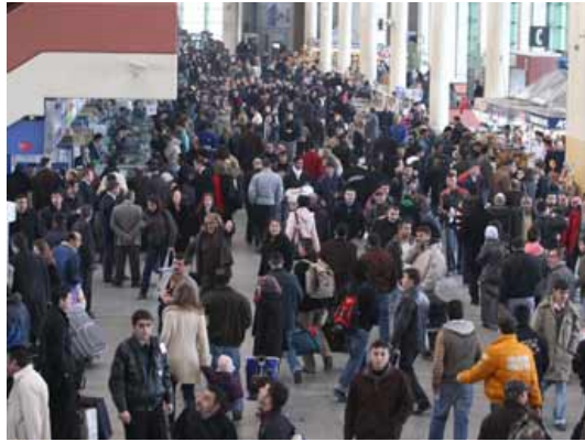
Fotoęraf 2.4: Nüfus yoğunluğunun kaynak talebinin karşılanmasını olumsuz etkilemesi

Bir toplumu meydana getiren bireylerin sayısına denir. Toplumlarda nüfus sayısını, bileşimini, dağılımını ve deęişimini inceleyen bilgi dalı demografi (nüfus bilimi) adını alır. Nüfus yoğunluğu ya da büyüme oranındaki hızlı deęişiklikler, olumlu ya da olumsuz yönde toplumsal deęişmelere neden olur. Nüfus yoğunluğunun hızla artış gösterdiği bir bölgede artan nüfusun kaynak talebinin karşılanması güçleşir.