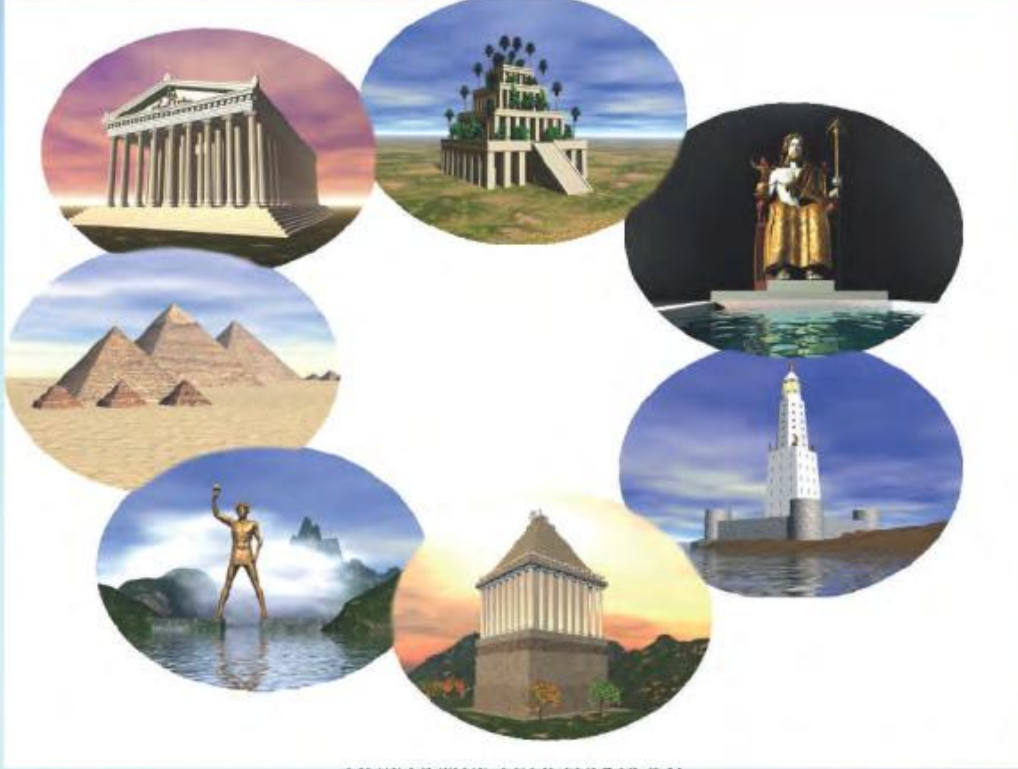
DÜNYANIN YEDİ HARİKASI

A) Aşağıdaki görselleri inceledikten sonra "Dünyanın Yedi Harikası" başlıklı metni noktalama işaretlerine dikkat ederek okuyunuz.