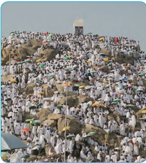
Arafat'tan bir görünüm

Hudeybiye Antlaşması'ndan iki yıl kadar sonra Mekkeli müşrikler, anlaşmayı bozdular. Bunun üzerine Peygamberimiz (s.a.v.), 10.000 kişilik bir orduyla Mekke'ye doğru yola çıktı. 630 yılında, önemli bir direniş ve çatışma yaşanmadan Mekke fethedildi. Kâbe putlardan temizlendi. Peygamberimiz (s.a.v.), kendisine eziyet eden Mekkelileri affettiğini bildirdi. Kimseden intikam almayı düşünmedi. Bunun üzerine birçok kişi Müslüman oldu. Mekke'nin fethiyle birlikte Arap Yarımadası'nda İslamiyet hızlı bir şekilde yayıldı.