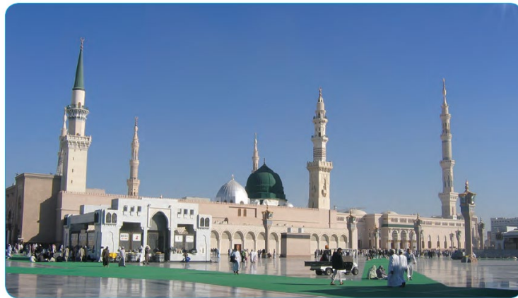
Mescid-i Nebi /Medine

İnançları uğruna Mekke'den Medine'ye göç eden Müslümanlara muhaçir denir. Muhaçirlere yardım eden, onlara her türlü desteği veren Medineli Müslümanlara da ensar denir.