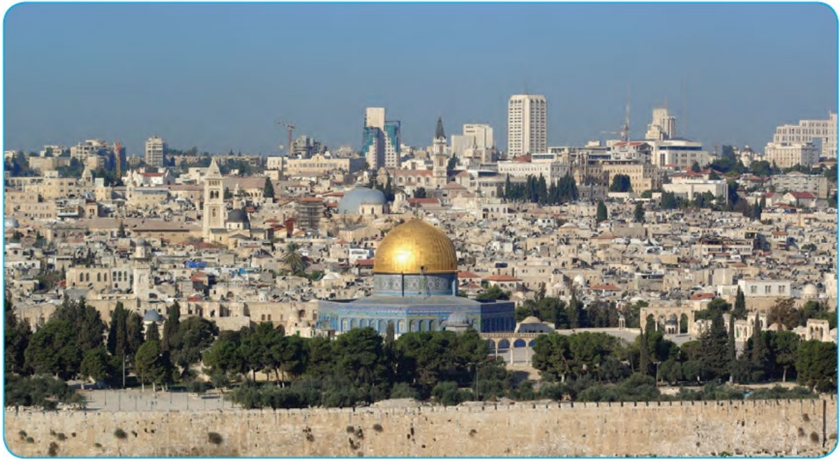
İsrâ ve Miraç mucizesinin gerçekleştiği Kudüs ve "Kubbetü's-Sahra" Müslümanlar için önemlidir

Hz. Peygamber'in (s.a.v.), Hicret'ten yaklaşık bir buçuk sene evvel (620), Kâbe'den Kudüs'teki Mescid-i Aksa'ya Allah'ın (c.c.) izniyle götürülmesine İsrâ, oradan göğe yükseltilerek kendisine Allah'ın (c.c.) ayet ve olağanüstü nimetlerinin gösterilmesine de Miraç denir.