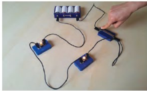
Görsel 7.1: Basit elektrik devresi ve sembolü

Basit bir elektrik devresinde sembolleri kullanarak yapılan devre çizimlerine devre şeması adı verilir. Aşağıda, bir devre ve bu devrenin sembolü verilmiştir.