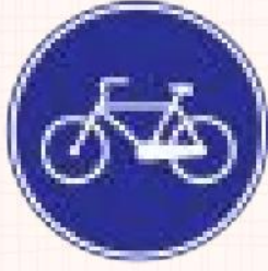
Mecburi Bisiklet Yolu